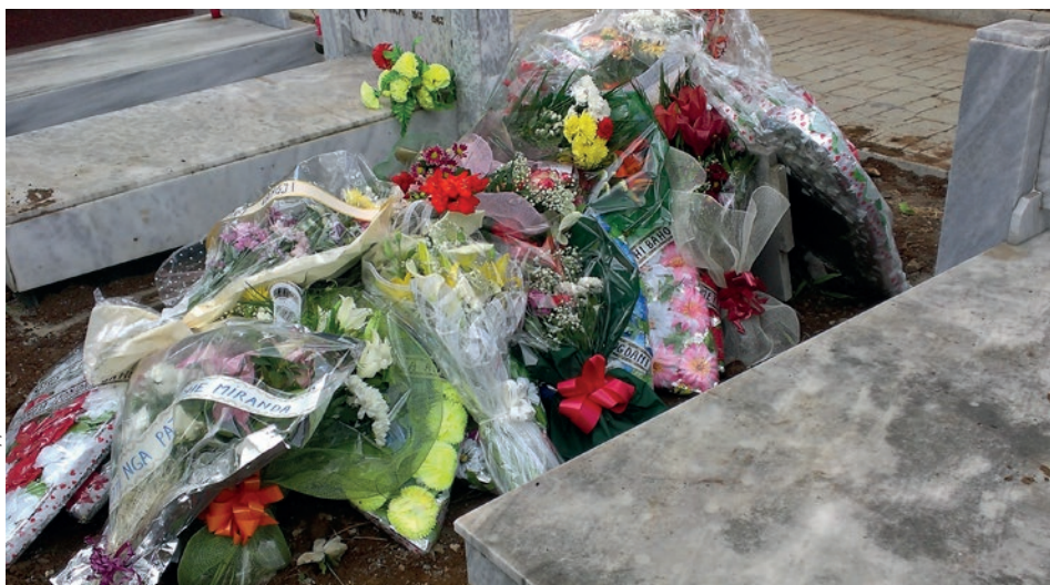
Vendi ku ajo prehet

Ne e falenderojmë atë për gjithçka të mirë dhe të dashur që ajo ka bërë për sa kohë jetoi dhe do të ruajmë për të një kujtim të nderuar dhe të dashur.