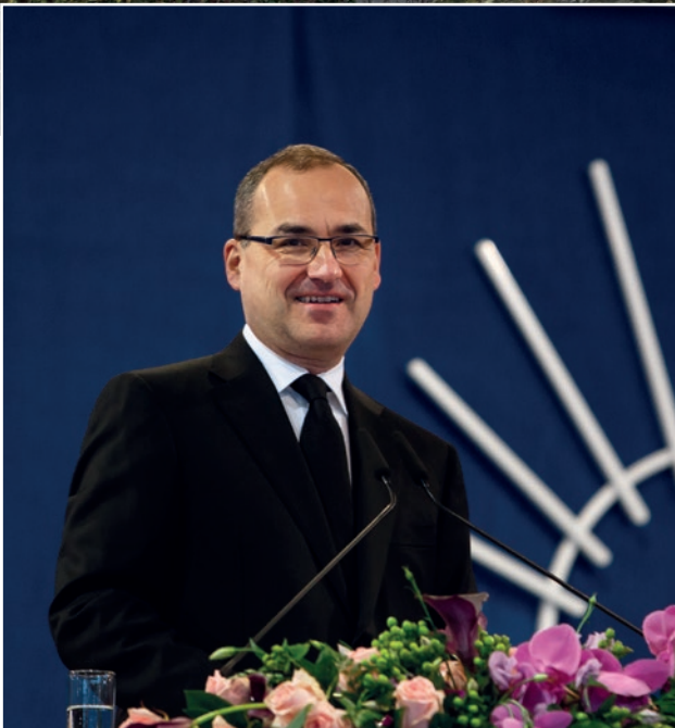
Shërbesa fetare e 11 Janarit 2015 në Luksemburg