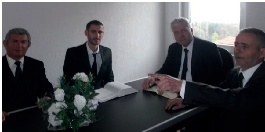
Apostul Otten me vëllezërit administratë në Pejë

Rreth orës 19.00 shkojmë për darke dhe biseda vazhdon mbi organizimin e bashkësisë, shërbesat fetare, punën e vellezerve të administratës, organizimin e shërbesës të dt.17 Maj, që do të organizohet vecanerisht për miq e të ftuar në të gjitha bashkësitë e Shqipërisë sidhe vizitën e Apostulit Kryesor që do të zhvillohet në muajin Korrik 2016 në Shqipëri.