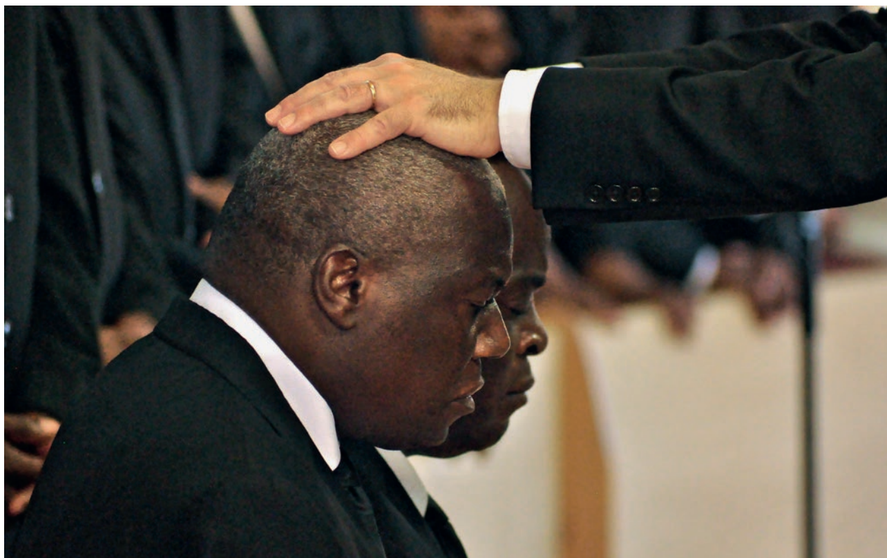
Attēls: Dienvidāfrikas Jaunapustuliskā baznīca