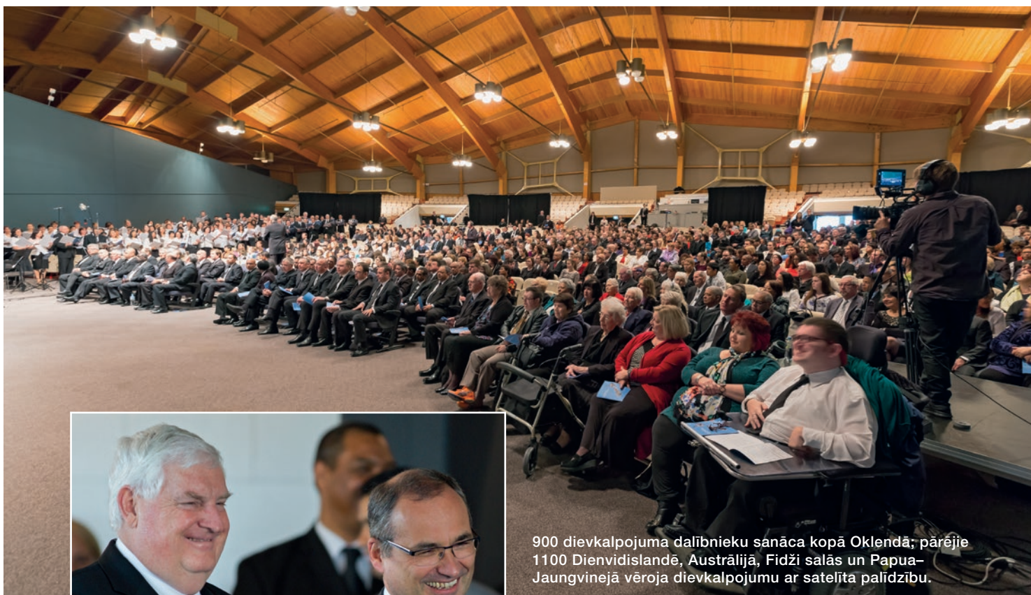
900 dievkalpojuma dalībnieku sanāca kopā Oklendā; pārējie 1100 Dienvidislandē, Austrālijā, Fidži salās un Papua-Jaungvinejā vēroja dievkalpojumu ar satelīta palīdzību.