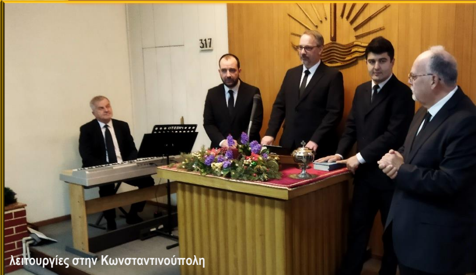
Λειτουργίες στην Κωνσταντινούπολη