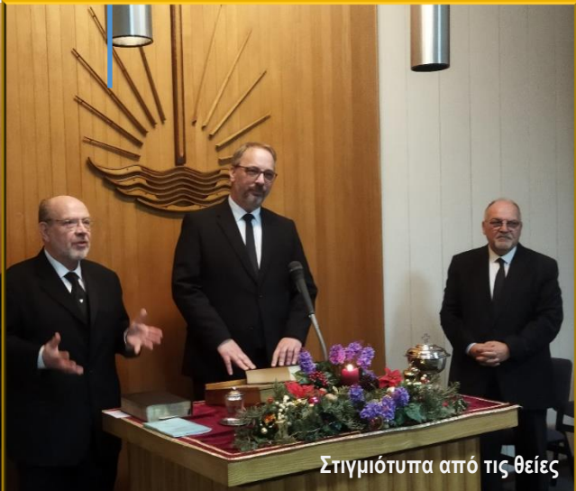
Στιγμιότυπα από τις θείες