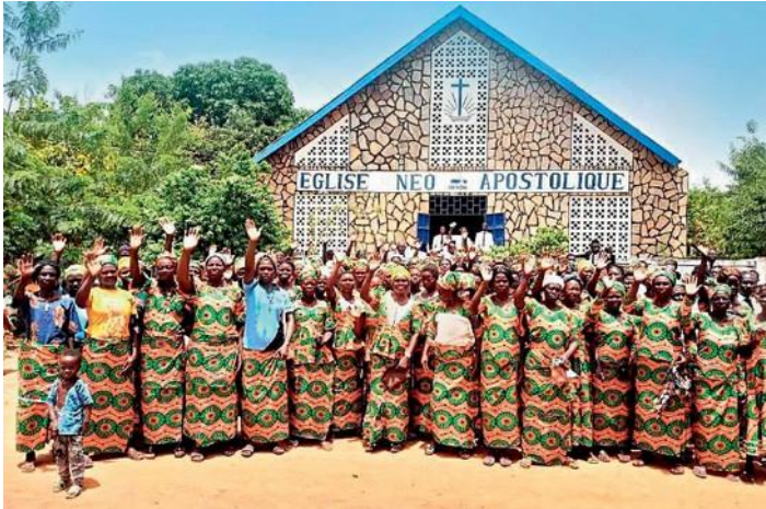
Φωτογραφία: Ν.Ε. Μπενίν και Τόγκο