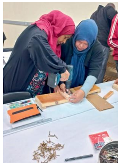
Οι νέοι δοκιμάζονται ως επιστήμονες πληροφορικής, κομμωτές ή τεχνίτες τοποθέτησης πλακιδίων.

Σε μια αφίσα, μπροστά από μια από τις Νεοαποστολικές εκκλησίες, είδε την προτροπή να εγγραφεί στα μαθήματα και εγγράφηκε τελικά στις 30 Ιανουαρίου.