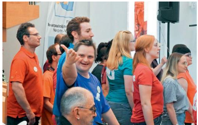
■ Φωτογραφία: Βέρνερ Φιλντ, Μπιάνκα Λεγιεντέκ