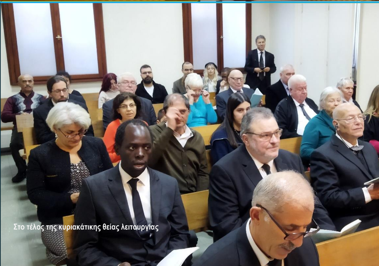
Στο τέλος της κυριακάτικης θείας λειτουργίας