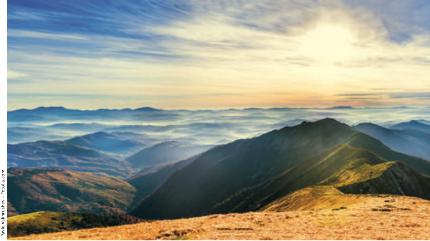
Pavlo Vakhrushev - Fotolia.com