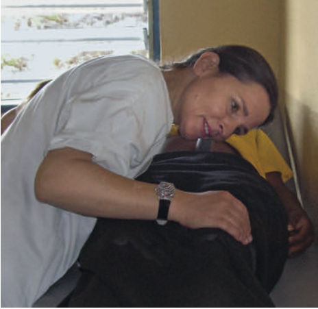
用一个皮纳德角，助产士就可以听胎儿的心跳