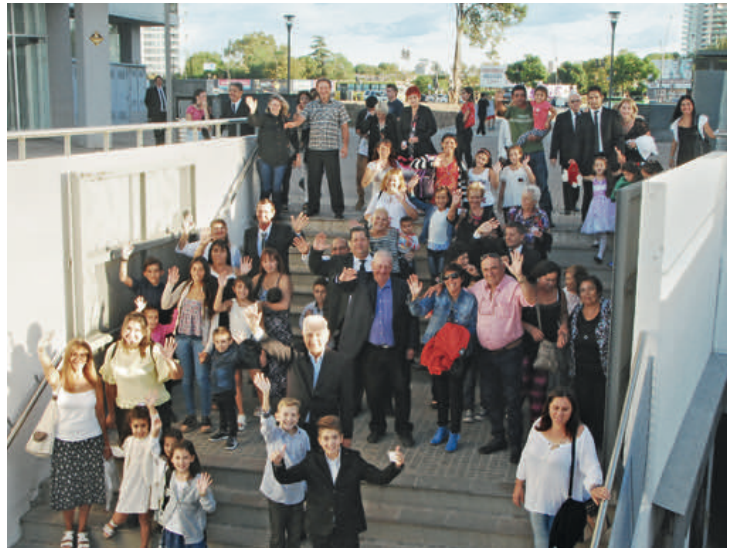
喜悦和兴奋无处不在。这是总使徒第一次访问阿根廷的该区域。