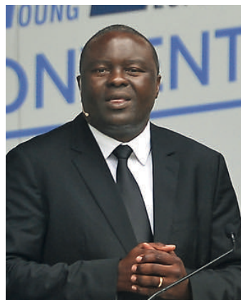
教区使徒 Tshitshi Tshisekedi (刚果)