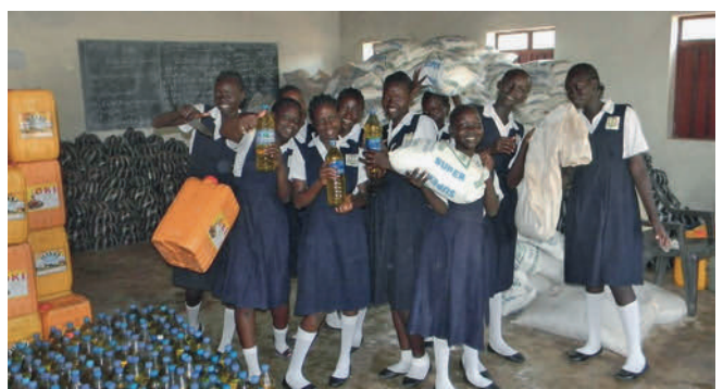
NAK-karitativ, NAC Southern Germany

在过去的几年中，救助组织NAK-karitativ在南苏丹已经做了很多：从建造幼儿园和小学，到为学校安装净水系统以及医疗站。此外，NAK-karitativ还与另一个慈善机构 human aktiv合作，提供食物袋，并为学校提供餐食。