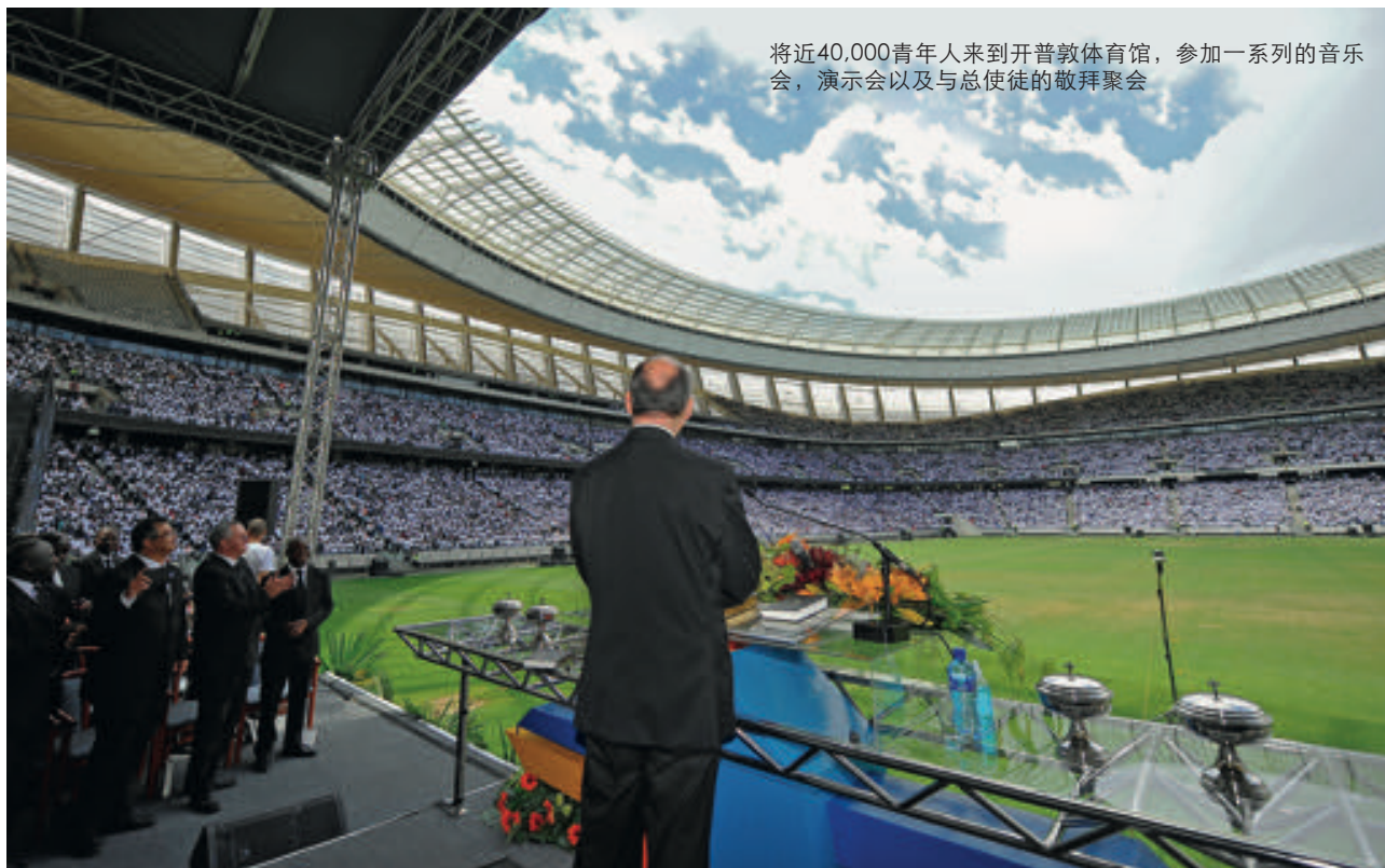
将近40,000青年人来到开普敦体育馆，参加一系列的音乐会，演示会以及与总使徒的敬拜聚会

行动。”第三个呼召：“来吧，我需要你！来服侍我。”这个邀请是对我们每一个人说的。