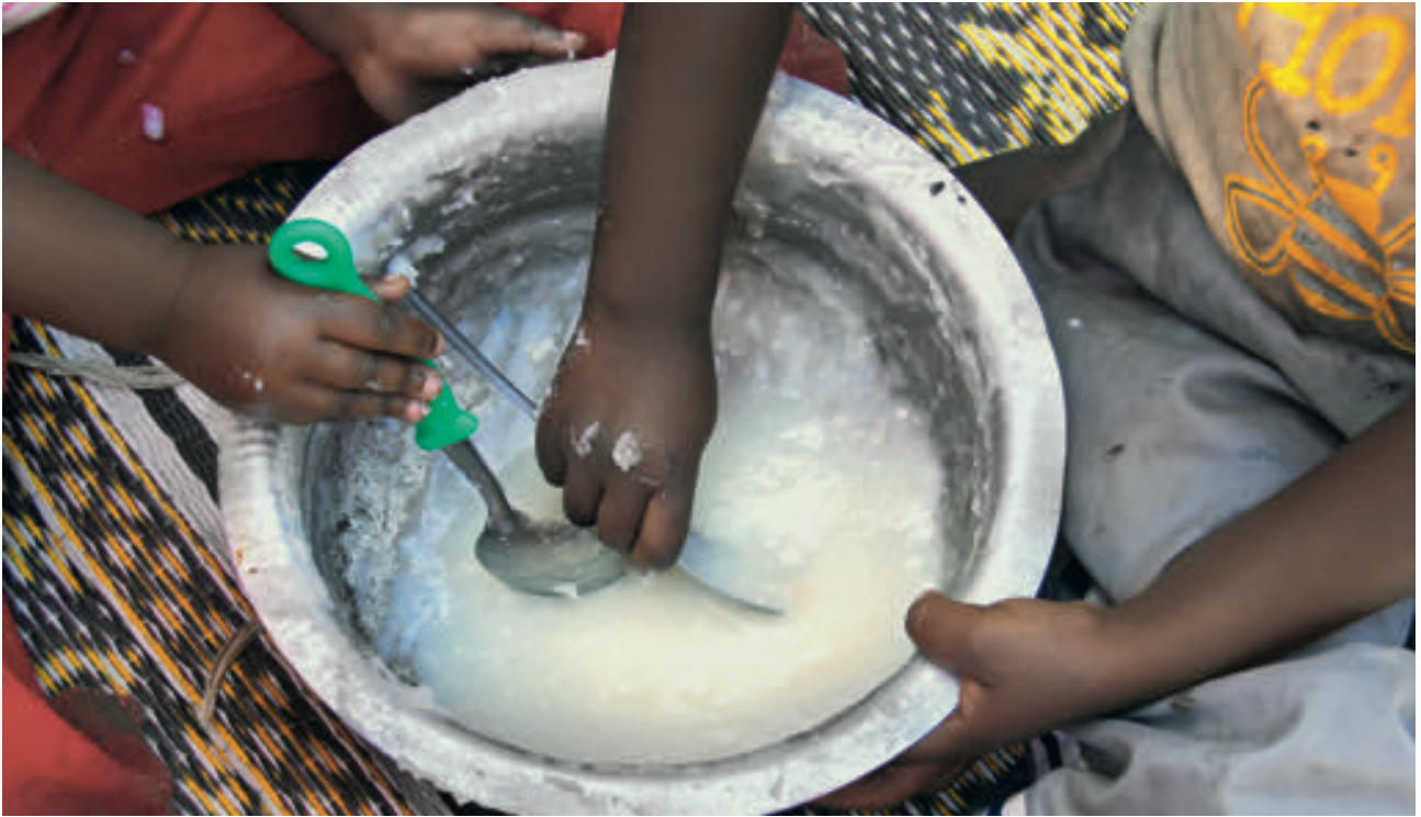
africa - Fotolia.com