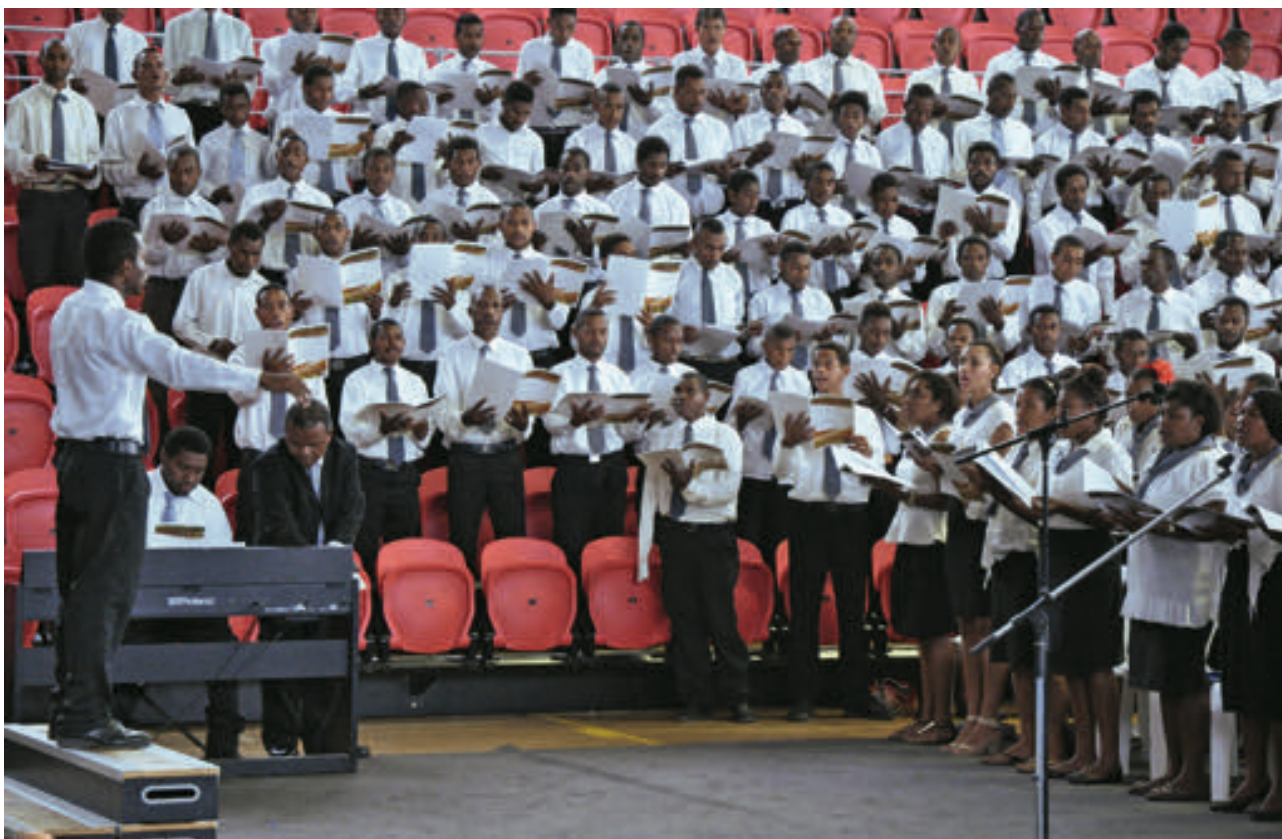
NAC Papua New Guinea

所有时间为所有的事情感谢神？这样的期望是不是太高？“那不现实，”总使徒让-卢克施耐德说，并继续解释了感恩的真正意思。以下是他于2017年10月1日在巴布亚新几内亚的莫尔斯比港举行的敬拜聚会的核心思想。