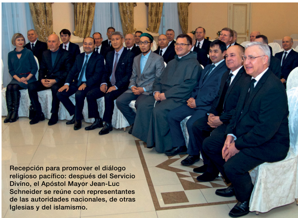
Recepción para promover el diálogo religioso pacífico: después del Servicio Divino, el Apóstol Mayor Jean-Luc Schneider se reúne con representantes de las autoridades nacionales, de otras Iglesias y del islamismo.