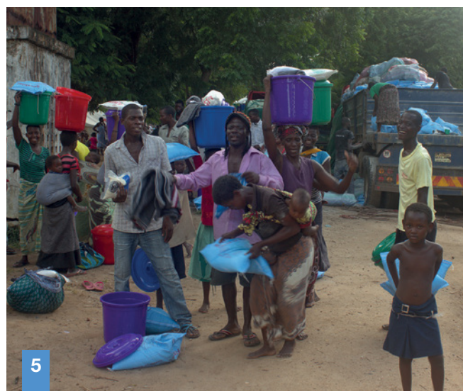
4| Des colis de première nécessité sont acheminés par camions vers la population 5| Distribution des colis au Bangula Camp

néo-apostolique vit dans le Bangula Camp avec ses huit enfants. Elle est reconnaissante pour chaque repas et pour chaque jour où ils n'ont pas à souffrir de la faim. La famille, qui se compose de dix personnes, vit dans ce camp depuis déjà trois mois. Leur maison est détruite. Un retour y est toujours proscrit. L'eau et la boue arrivent à hauteur de genoux dans leur maison.