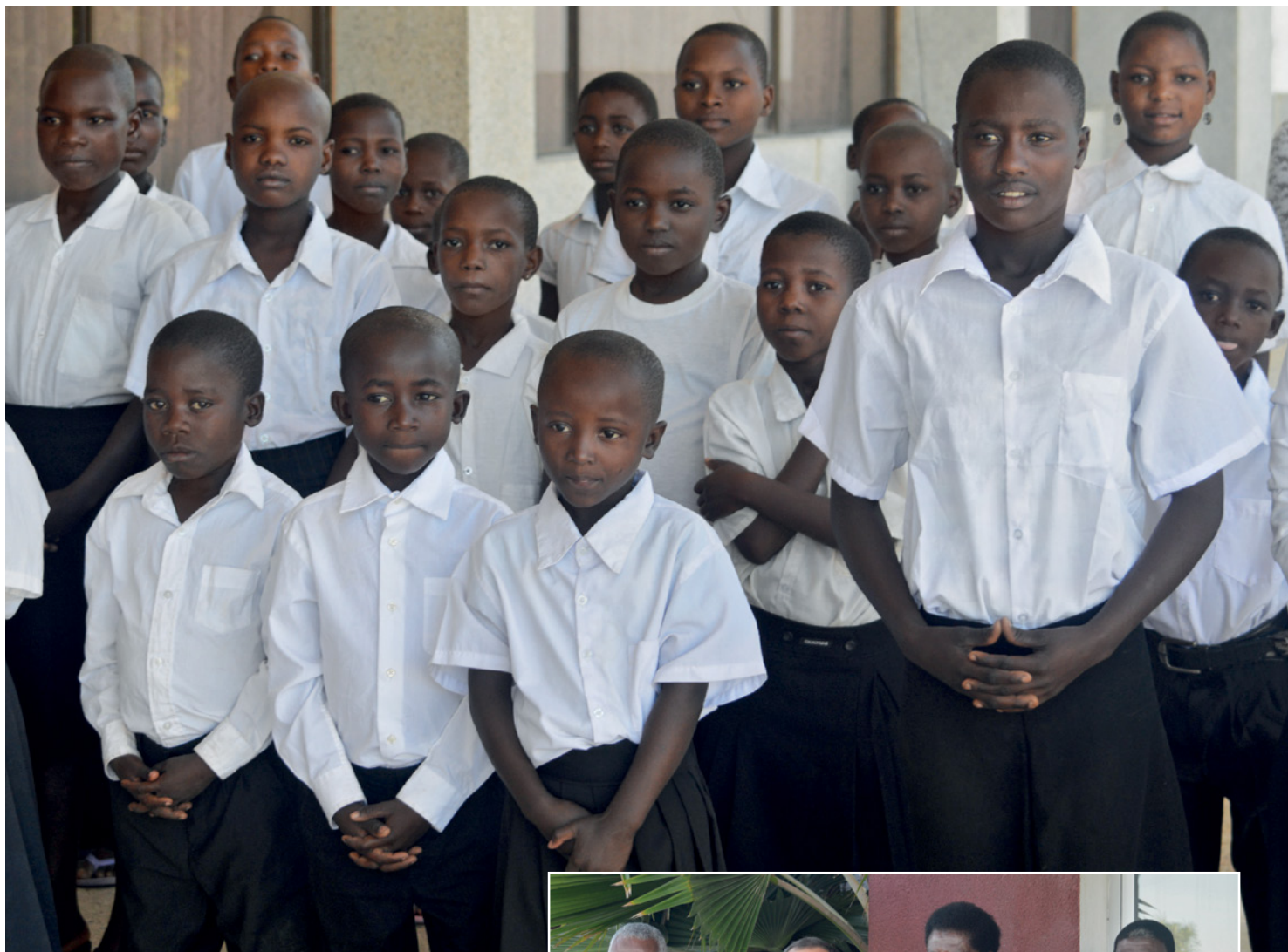
Les enfants accueillent l'apôtre-patriarche Schneider et les apôtres avant le service divin du 19 avril 2015 à Dodoma (Tanzanie)