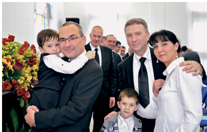
Après 2003 et 2009, c'est à présent la troisième visite d'un apôtre-patriarche qui se prépare. L'apôtre-patriarche Schneider a été chaleureusement accueilli.