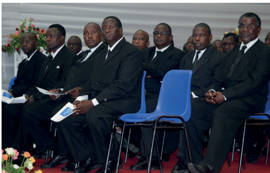
Les apôtres et les évêques à droite de l'autel

Pour le Seigneur, la vie éternelle sera toujours plus importante que toutes les choses terrestres. Il ne fait donc aucun sens de lui demander de changer les priorités.