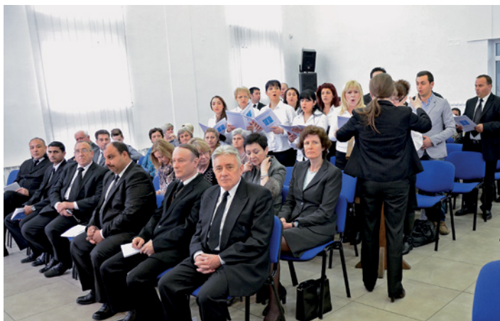
Les chrétiens néo-apostoliques vivent en Macédoine depuis 1958. Aujourd'hui, 400 frères et sœurs vivent dans ce pays d'Europe du sud.