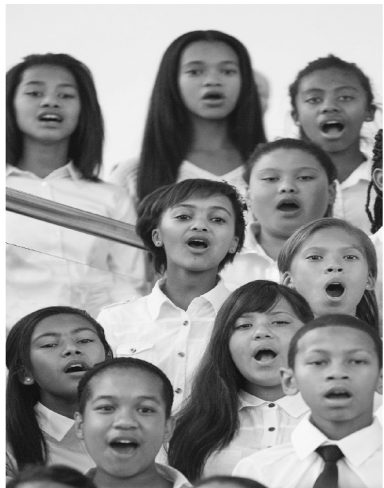
... ponekad kao solistica, ponekad kao članica zbora (slika lijevo: 2. zdesna, slika gore: u sredini)