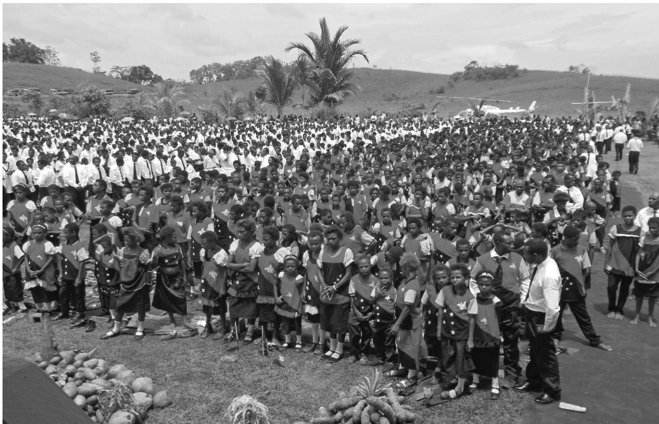
Neki su vjernici pješačili i do sedam dana. Da bi ih ugostile, zajednice iz okolice Kombikuma su mjesecima ranije zasadile dodatne poljoprivredne kulture i podigle nastambe za smještaj gostiju.

Poznajem mnoge ljude koji se s takvim razmišljanjem ne slažu te jadikuju da su siromašni i da ničega nemaju. Kao djeca Božja znamo da nam je Bog dao dovoljno tako da uvijek možemo pomoći bližnjemu. To je naša vjera. Vjerujemo da nam je Bog darovao dovoljno za život i da smo u stanju vršiti njegove zapovijedi. Nismo prisiljeni grijehiti da bismo stekli ono što nam je potrebno. Mnogi ljudi misle da moraju krasti jer nemaju dovoljno. Izgubili su svako poštenje, jer žele uvijek više. To nije naša vjera. Mi smo zadovoljni s onim što uz uvažavanje božanskih zakona možemo privrijediti. Vjerujemo da nam je Bog dao dovoljno da možemo vršiti njegove zakone.