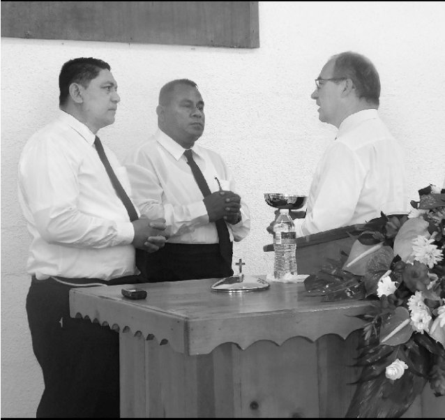
Zajednica slavi Svetu večeru za pokojne