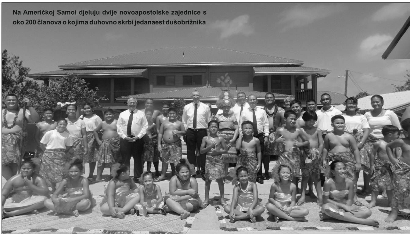
Na Američkoj Samoju djeluju dvije novoapostolske zajednice s oko 200 članova o kojima duhovno skrbi jedanaest dušobrižnika