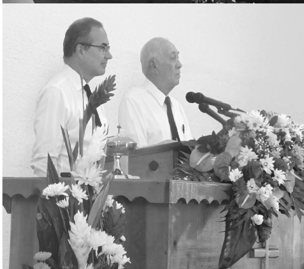
Na službi Božjoj je sudjelovalo 168 vjernika

Kada prinosimo svoje žrtve, zahvaljujemo mu dakle za njegove zemaljske darove. Znamo da je to milost. Bog nije prisiljen dati nam ono što nam je potrebno. Ima mnogo ljudi koji imaju manje nego mi, a zaslužni su jednako kao i mi. Tako prinosimo svoju žrtvu da zahvalimo Bogu, davatelju.