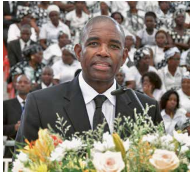
Complementaron la prédica el Apóstol de Distrito Patrick Mkhwanazi (África del Sudeste, foto arriba a la derecha) y el Apóstol de Distrito Noel E. Barnes (Cabo)