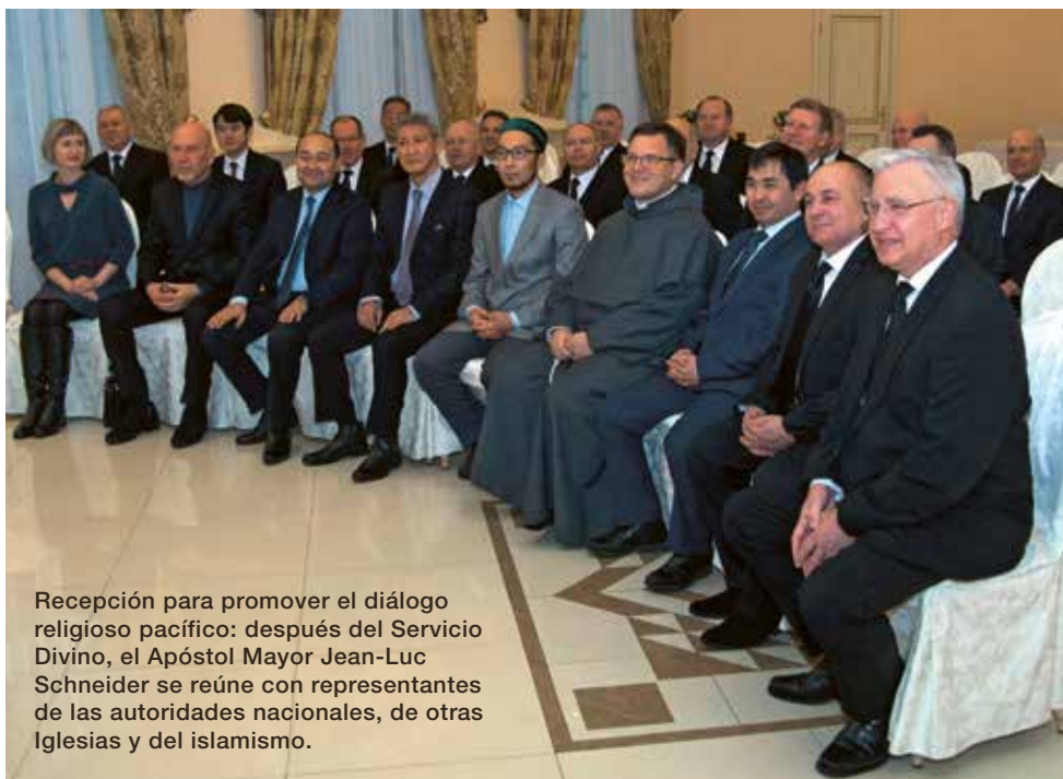
Recepción para promover el diálogo religioso pacífico: después del Servicio Divino, el Apóstol Mayor Jean-Luc Schneider se reúne con representantes de las autoridades nacionales, de otras Iglesias y del islamismo.