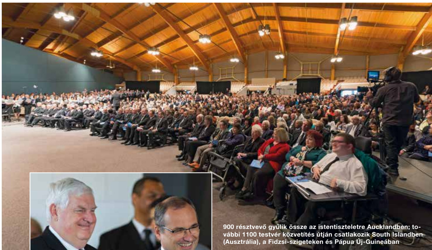
900 résztvevő gyűlik össze az istentiszteletre Aucklandben; további 1100 testvér közvetítés útján csatlakozik South Islandben (Ausztrália), a Fidzsi-szigeteken és Pápua Új-Guineában