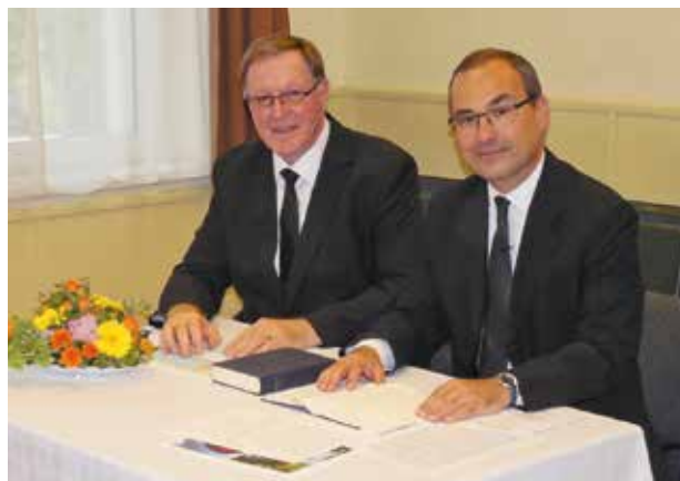
A sekrestyében Budapesten