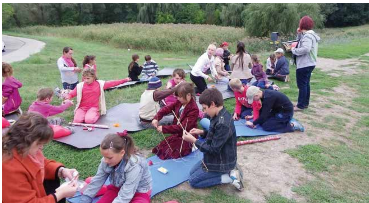
Kiscsoportokban készülnek a sárkányok.