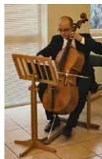
Néha egy csellón kísért szép szóló is felcsendül.