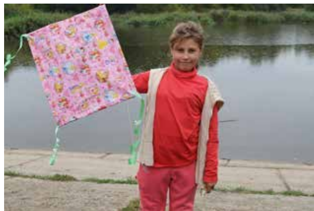
Egy gyerek a maga által készített sárkánnyal.

A NAK-Humanitas 25'000 euróval támogatta a képzés- és egészségprojektet.