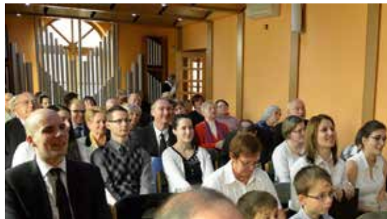
Apostoli istentiszteletet boldog testvérekkel (fent jobbra) gazdagítják a gyülekezeti életet.