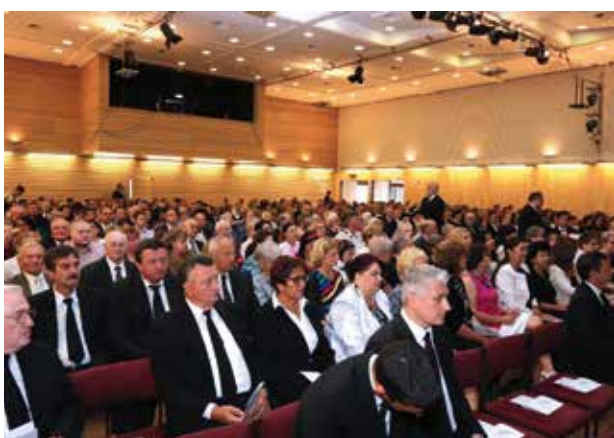
A gyülekezet a bécsi istentiszteleten