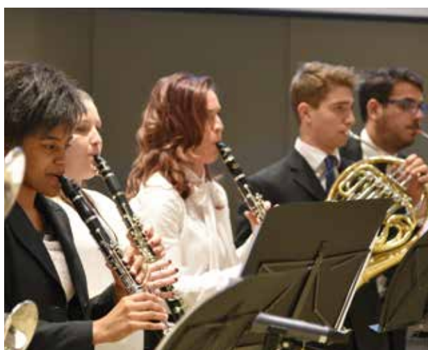
Zenekar az istentiszteleten