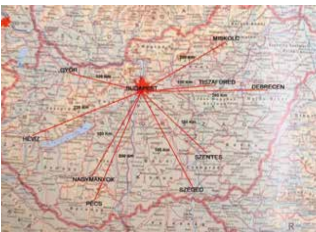
Magyarország tíz gyülekezete.