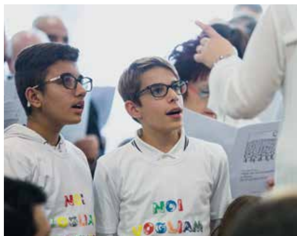
A gyerekek énekelnek