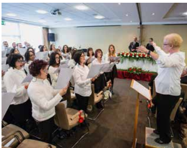
Szép zenei előadásokkal keretezi a kórus az istentiszteletet