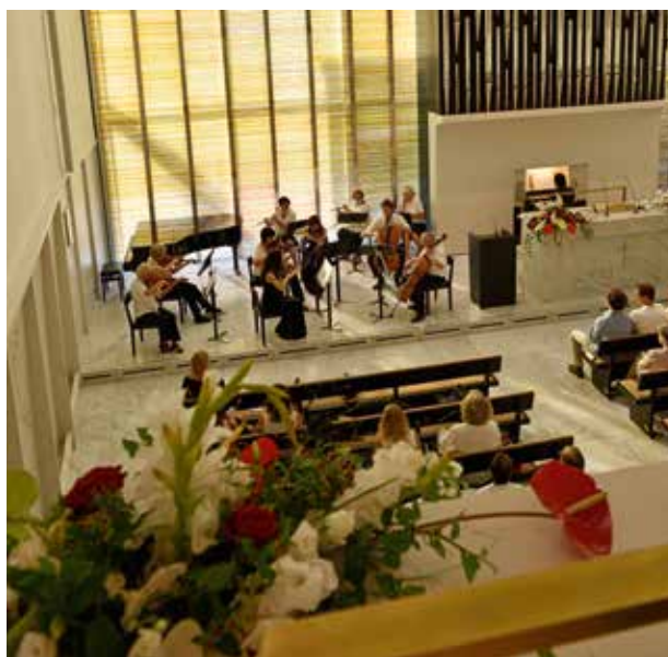
Orgona és zenekar előadása