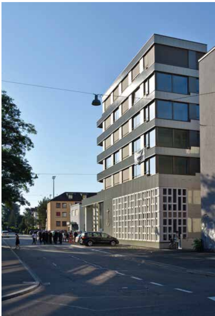
Zürich-Albisrieden új templomának külső látványképe