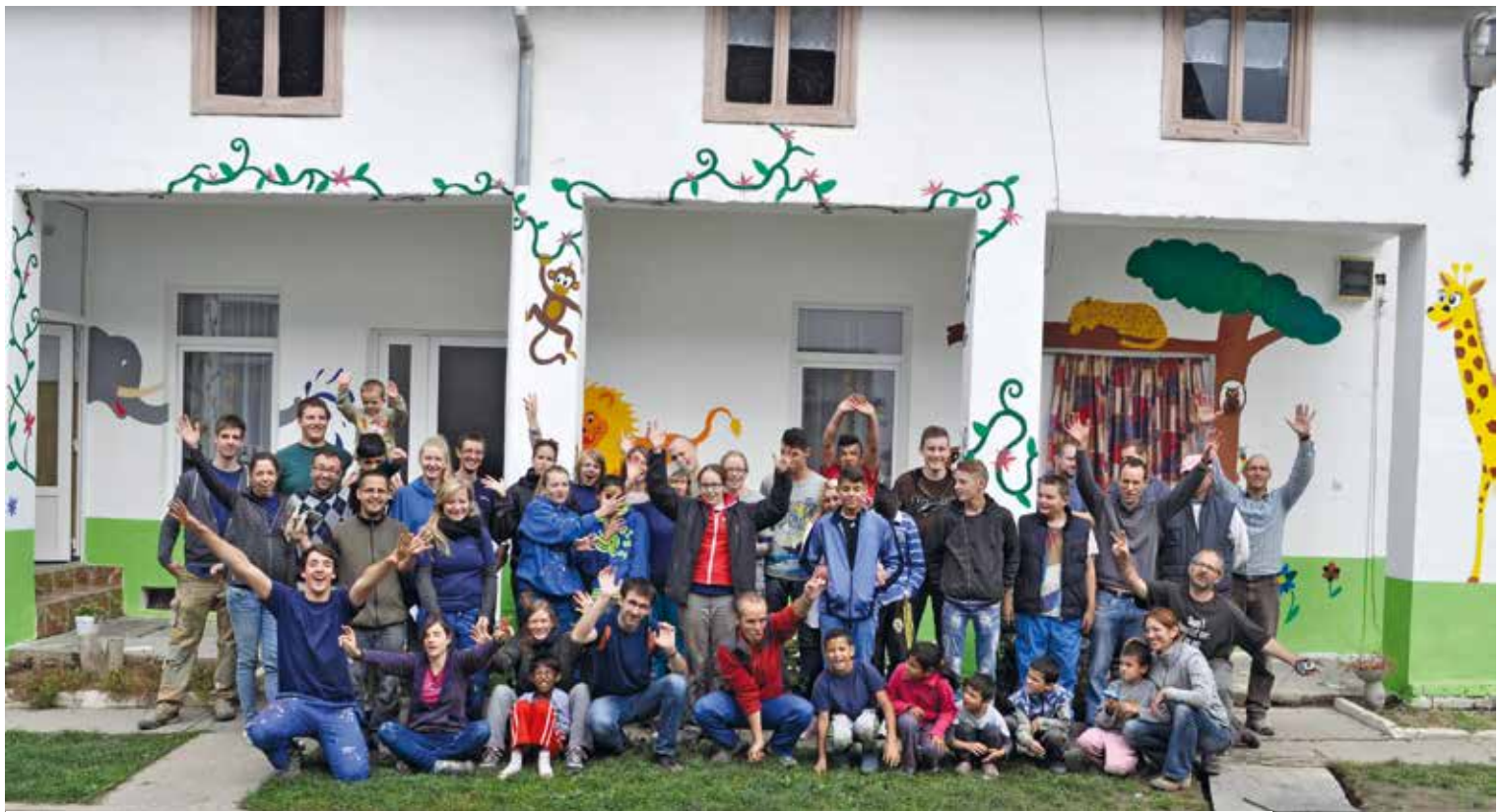
Elkészült! Büszkén pózolnak a thuni fiatalok a kit-a színesre festett homlokzata előtt Zabraniban.