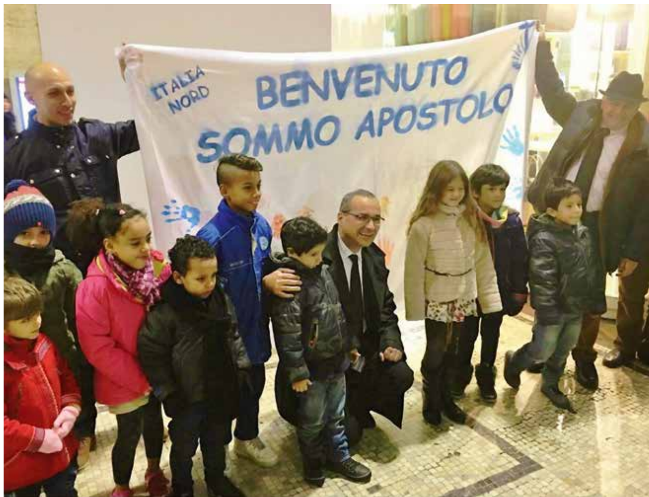
Szívélyesen köszöntik a főapostolt megérkezéskor a milánói pályaudvaron

Schneider apostolt meghatotta az olaszországi testvérek részvétele és öröme. Hangos „Ciao” kiáltással búcsúzott a testvérektől.