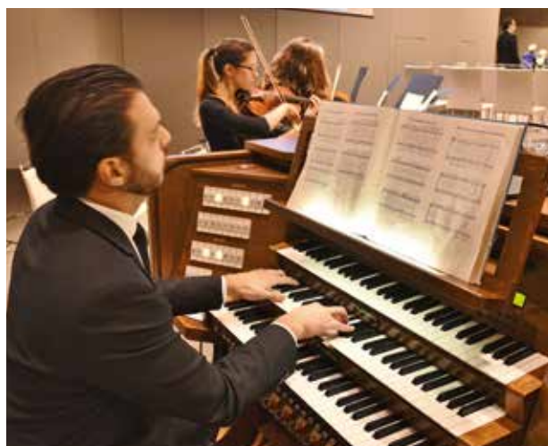
Az organista a milánói istentiszteleten