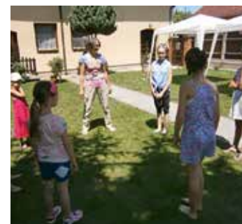
Azután játszás következik a templomkertben.