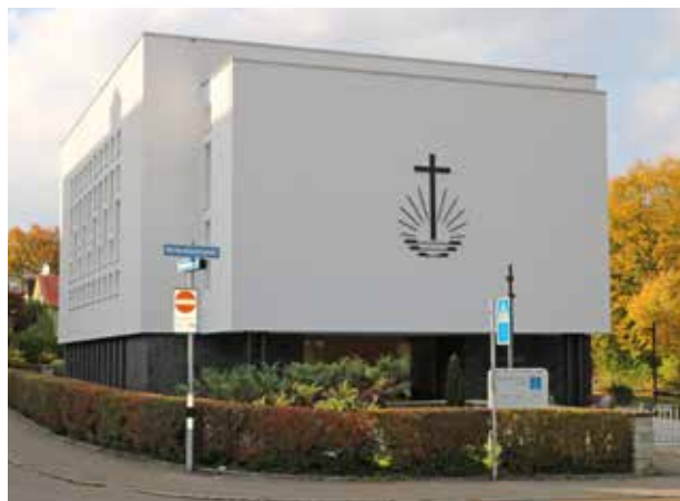
A Zürich-seebachi templom külső homlokzata