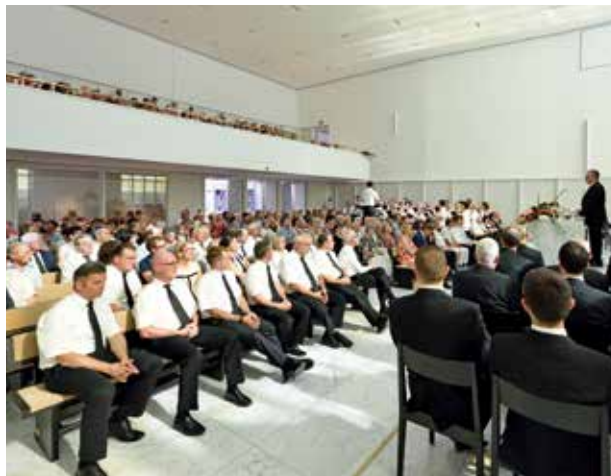
Az ünnepi gyülekezet Zürich-Albisriedenben