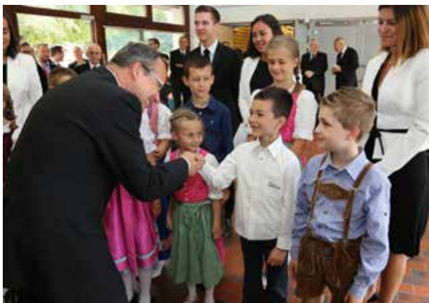
A főpostol köszönetet mond a gyerekeknek az énekért, amit bécsi dialektusban adtak elő.