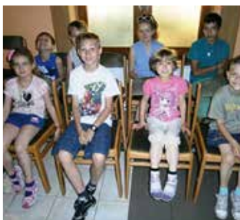
Rendszeresen megrendezésre kerülő kórusnapok, mint Budapesten a 2015. június 6-i, emelik az éneklés nyújtotta örömet – és a gyerekek is énekelnek.