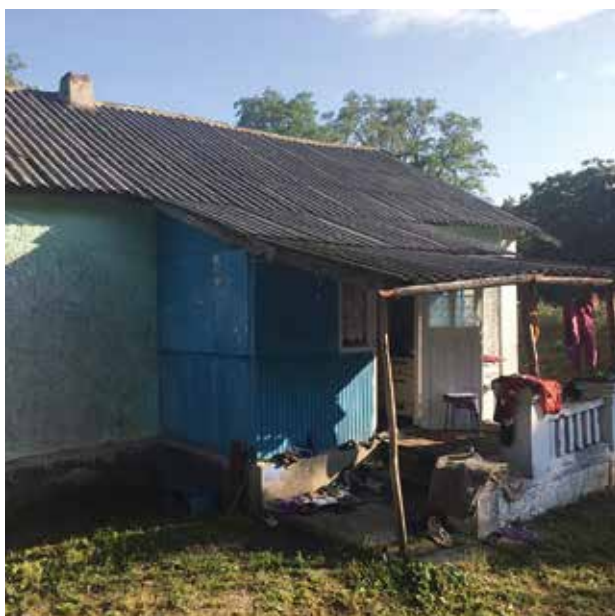
Ebben a házban került sor az istentiszteletre