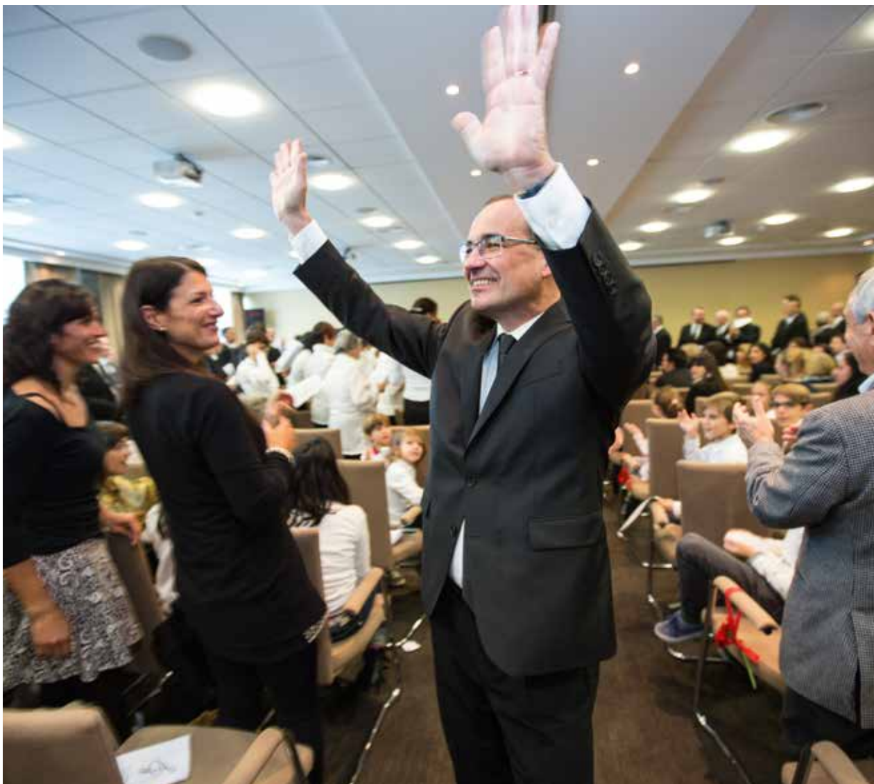
Egy örömtől sugárzó főapostol búcsúzik a testvérektől Rómában

első helyet Jézus tölti be. Élünk szomorúságban vagy örömben, Jézus Krisztus az első beszélgetőtársunk. Hozzá hasonlóképpen akarunk viselkedni, minden ha és de nélkül. Isten megbocsátja a bűneinket, és mi megbocsátunk felebarátunknak. Így teljesítjük Isten akaratát. Ha ennek értelmében cselekszünk, akkor Jézusé az utolsó szó, és nem a miénk. Ez egyértelmű bizonyítéka annak, hogy mindent az Úrral kezdünk, és az Úrral fejezünk be?”