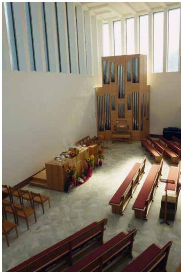
Az oltár és az orgona látványa a karzatról