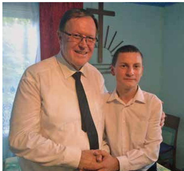
Fehlbaum körzeti apostol egy újonnan felszentelt diakónussal