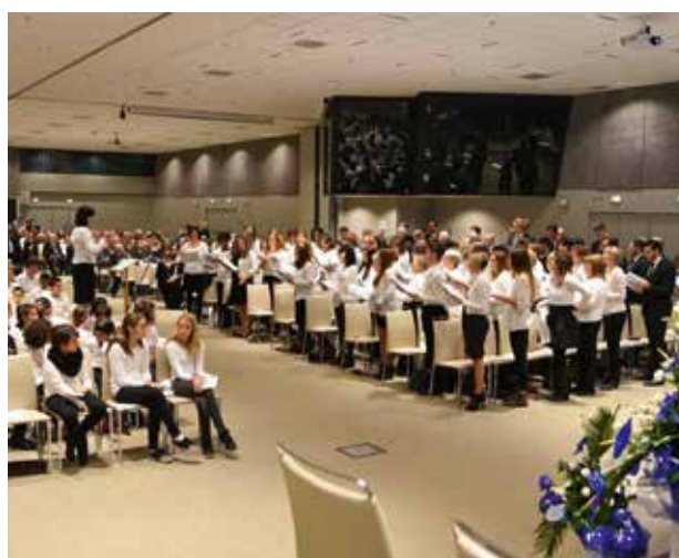
A kórus előadása