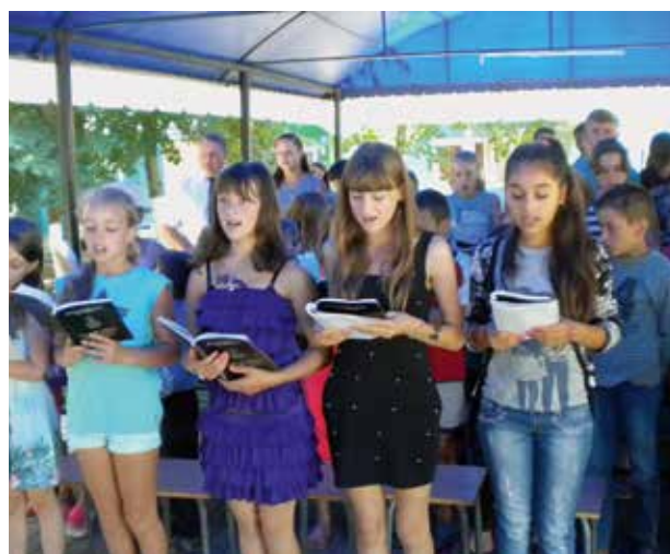
Gyerekek a körzeti apostollal