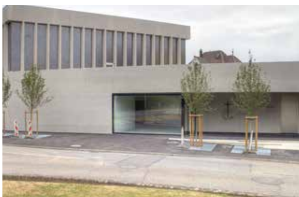
Zofingen új templomának külső homlokzata