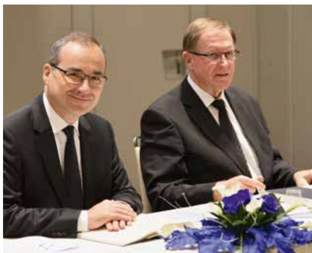
A főapostol és a körzeti apostol a sekrestyében