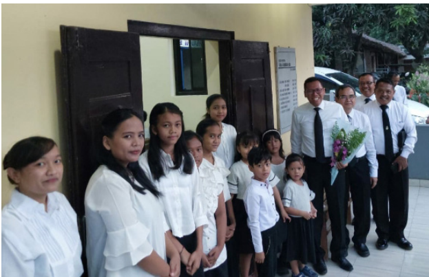
Atas: Saudara-saudari kita di Sidang Jemaat Sokawangi