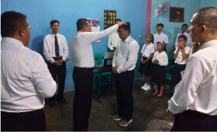
Berkat Kemeteraian Kudus kepada 1 jiwa dewasa di Sidang Jemaat Pecangakan