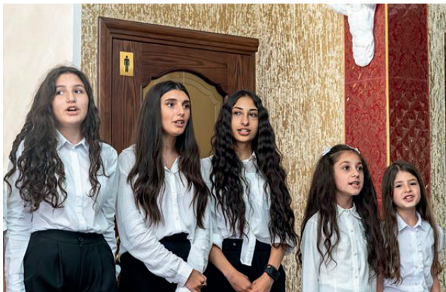
Աղջիկների երգչախումբը Գյումրիի համայնքից