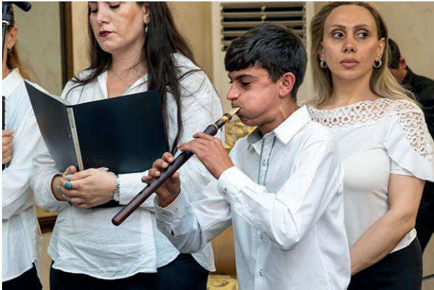
Վանաձորի համայնքից մի պատանի երաժշտական մի հատված է կատարում դուդուկով հայկական ավանդական սրինգով