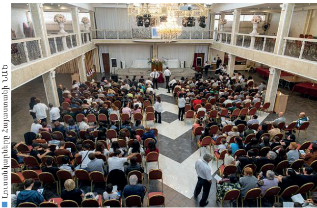
Լուսանկարները Հայաստանի ԱՄՆ