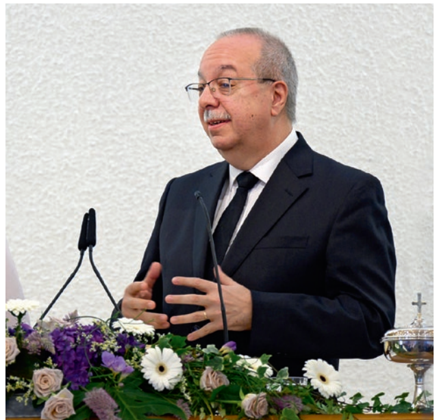
Շրջանային առաքյալ Էնրիքվե Մինիո

Երբեմն այդ սերը լինում է միայն տեսական՝ շատ խոսքեր, բայց, ցավոք, քիչ գործեր: Աֆրիկայում այս առումով կա մի գեղեցիկ պատմություն