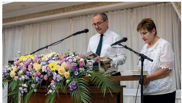
Գլխավոր առաքյալ Ժան-Լյուք Շնայդերը ծառայում է Հայտնությունից վերցրված աստվածաշնչյան խոսքով