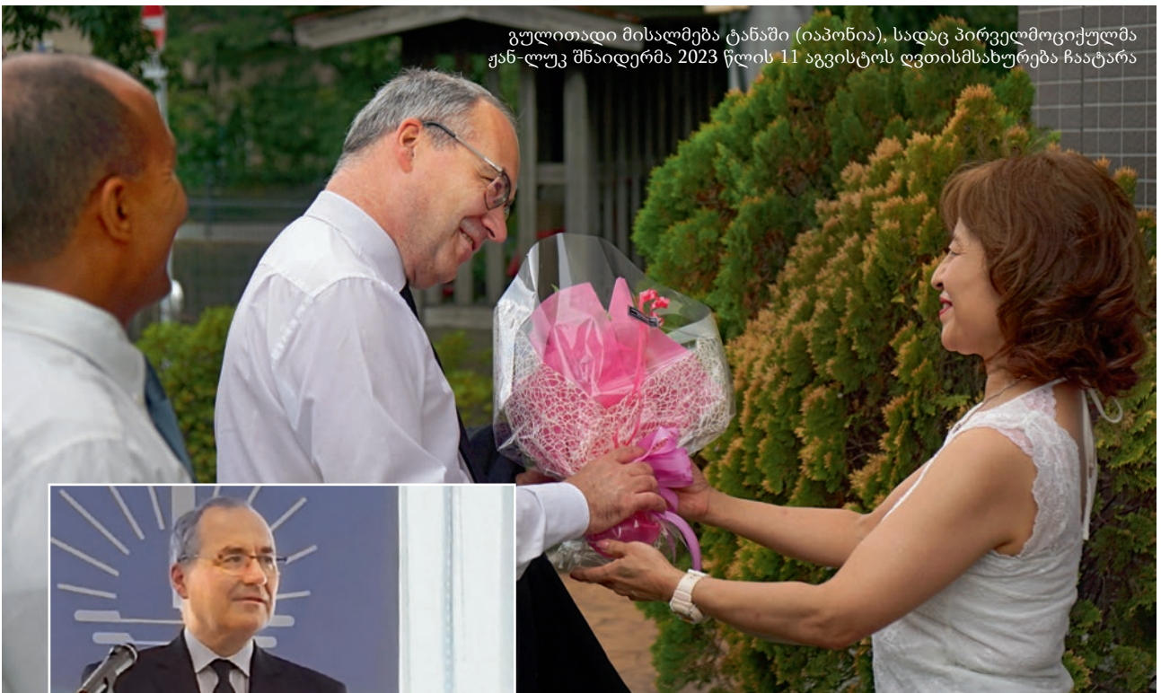
გულითადი მისალმება ტანაში (იაპონია), სადაც პირველმოციქულმა ჟან-ლუკ შნაიდერმა 2023 წლის 11 აგვისტოს ღვთისმსახურება ჩაატარა