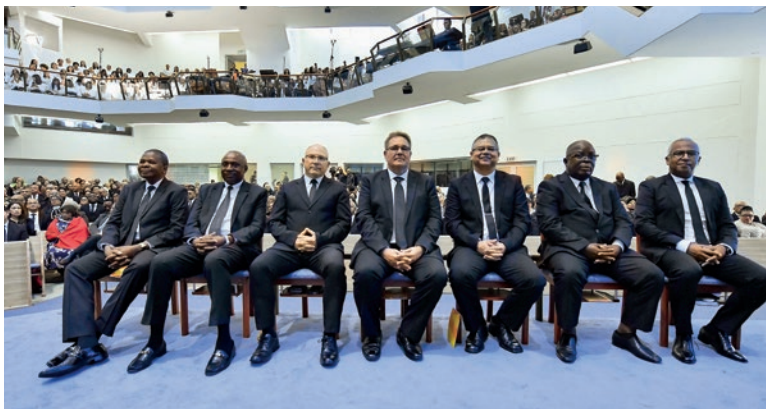
ორმოცდაათობისადმი მიძღვნილ ღვთისმსახურებას სამხ. მოციქულები და მოციქულთა დიდი რაოდენობა დაესწრო