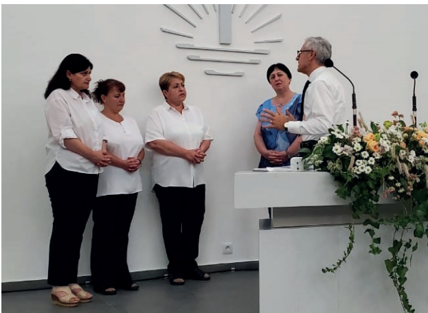
მღვდელმსახურები საქართველოდან, სომხეთიდან და აზერბაიჯანიდან

სამი ერთმორწმუნე სომეხი დის დიაკვნად კურთხევა