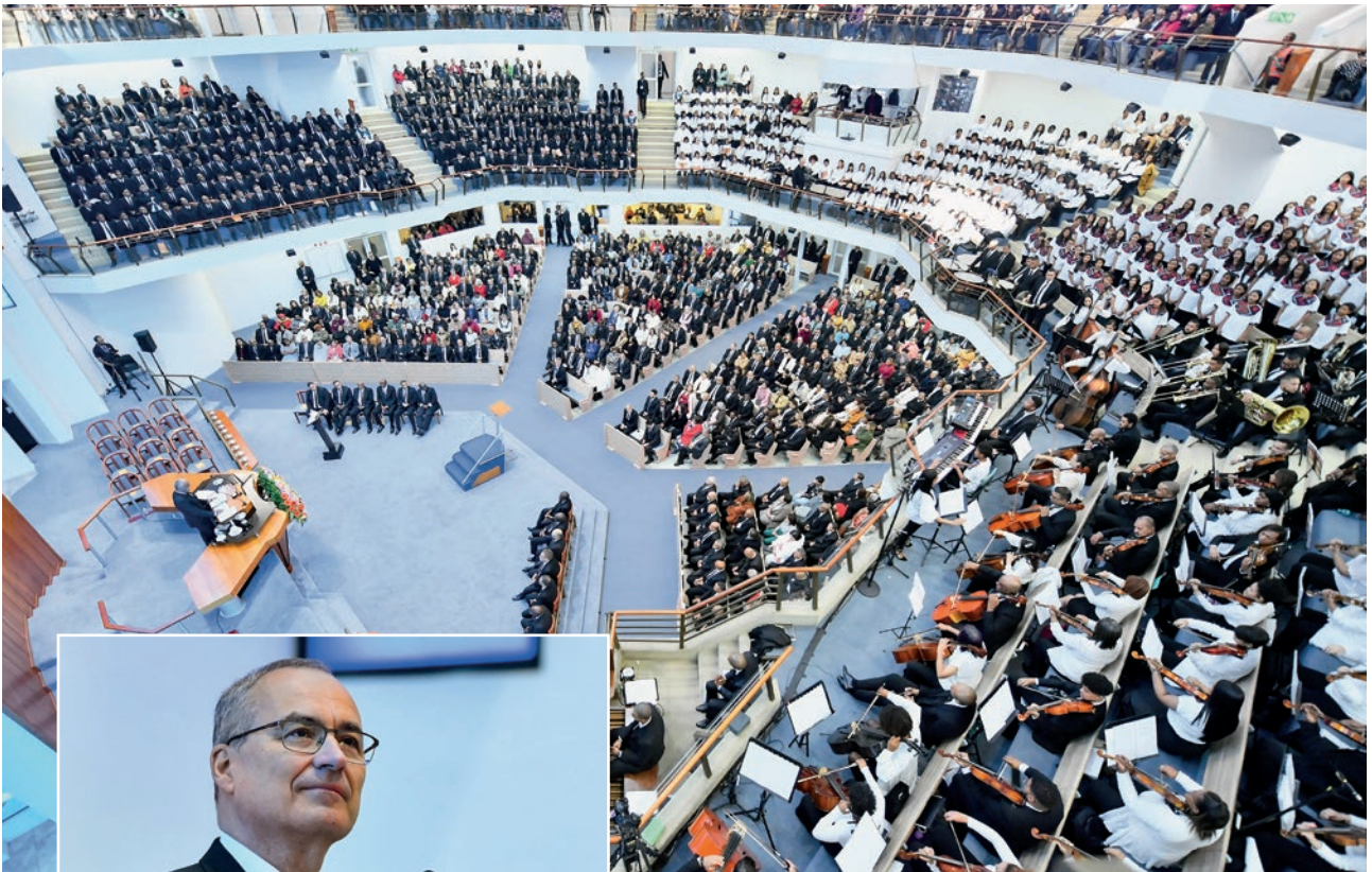
ფოტოები: გრანტ პიჩერი, დელაბანე ვორუტი