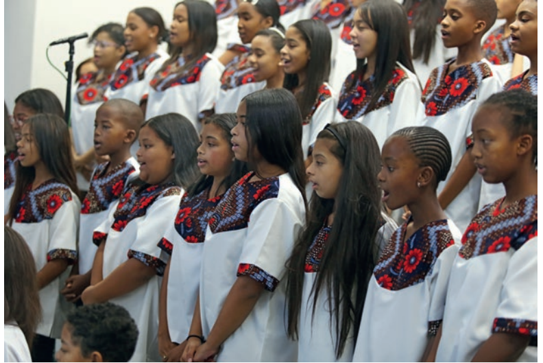
სამხ. ეკლესიის მუსიკალური განყოფილების გუნდმა, ზავშვთა გუნდმა და ორკესტრმა ჯონ როდრიგესის სიმღერით „სულით განახლებული“ კუბლიკა ადაფრთოვანა

ის სიყვარულის სულიც არის. ვიცი, როცა სიყვარულზე ვალაპარაკობთ, გაუგებრობას აქვს ადგილი, ვინაიდან ამ დროს კაცსა და ქალს შორის სიყვარულს, მშობლებსა და შვილებს შორის სიყვარულს ვგულისხმობთ. მაგრამ მთლად ასე არ არის. ღვთიური სიყვარული ბევრად მეტია, ვიდრე მხოლოდ ემოციები და გრძნობები. ღვთიური სიყვარული ძლევა მოსილი აღთქმაა.