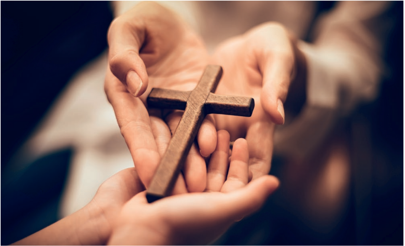
■ Lmսսմկարտ : sticker2you - stock.adobe.com