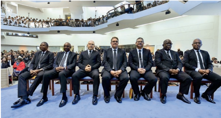
Հոգեգալստյան տոնին ներկա էին շրջանային առաքյալը և շատ այլ առաքյալներ