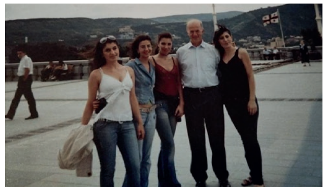
Երգչախմբի աղջիկները առաքյալ Վ, Հոյերի հետ՝ 2009-ի Երիտասարդների օրը Գերմանիայում

ելույթ է ունեցել նաև մարզային եկեղեցիներում անցկացվող ժամերգությունների ժամանակ: Եղել են էլույթներ նաև Վրաստանի նորառաքելական եկեղեցու համայնքներում: 2009 թվականին մեր երգչախմբի անդամներից մի քանիսը մասնակցեցին