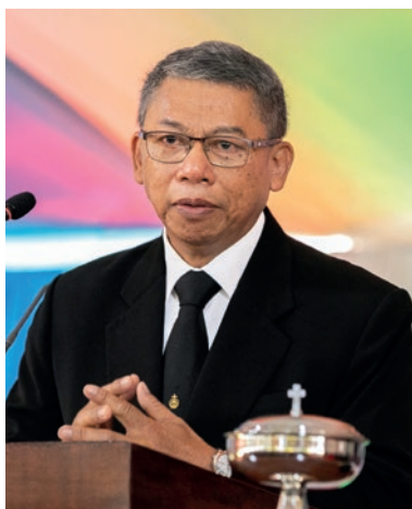
Reikia tarnauti Dievui iš meilės.

Jozuė čia sako, kad jis ir jo šeimyna troško tarnauti Viešpačiui. Taigi, jis pats ir visi, kurie jam buvo patikėti. Žinoma, mes galvojame apie tarnus ir jiems patikėtus tikinčiuosius. Mes galvojame apie tėvus su savo vaikais. Manau, kad jie visi trokšta tarnauti Viešpačiui kartu su visais, kurie jiems patikėti, bet negalime nieko priversti tarnauti Viešpačiui. Mes neturime teisės to daryti ir tai nėra Dievo valia.