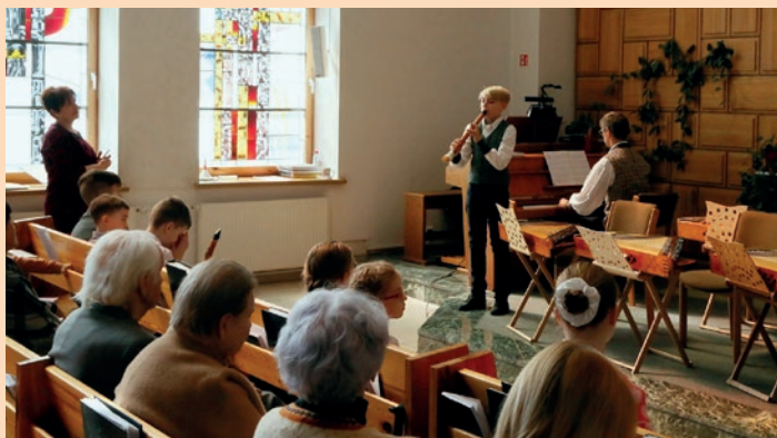
Koncertas „Melodijų pynė Mamai”