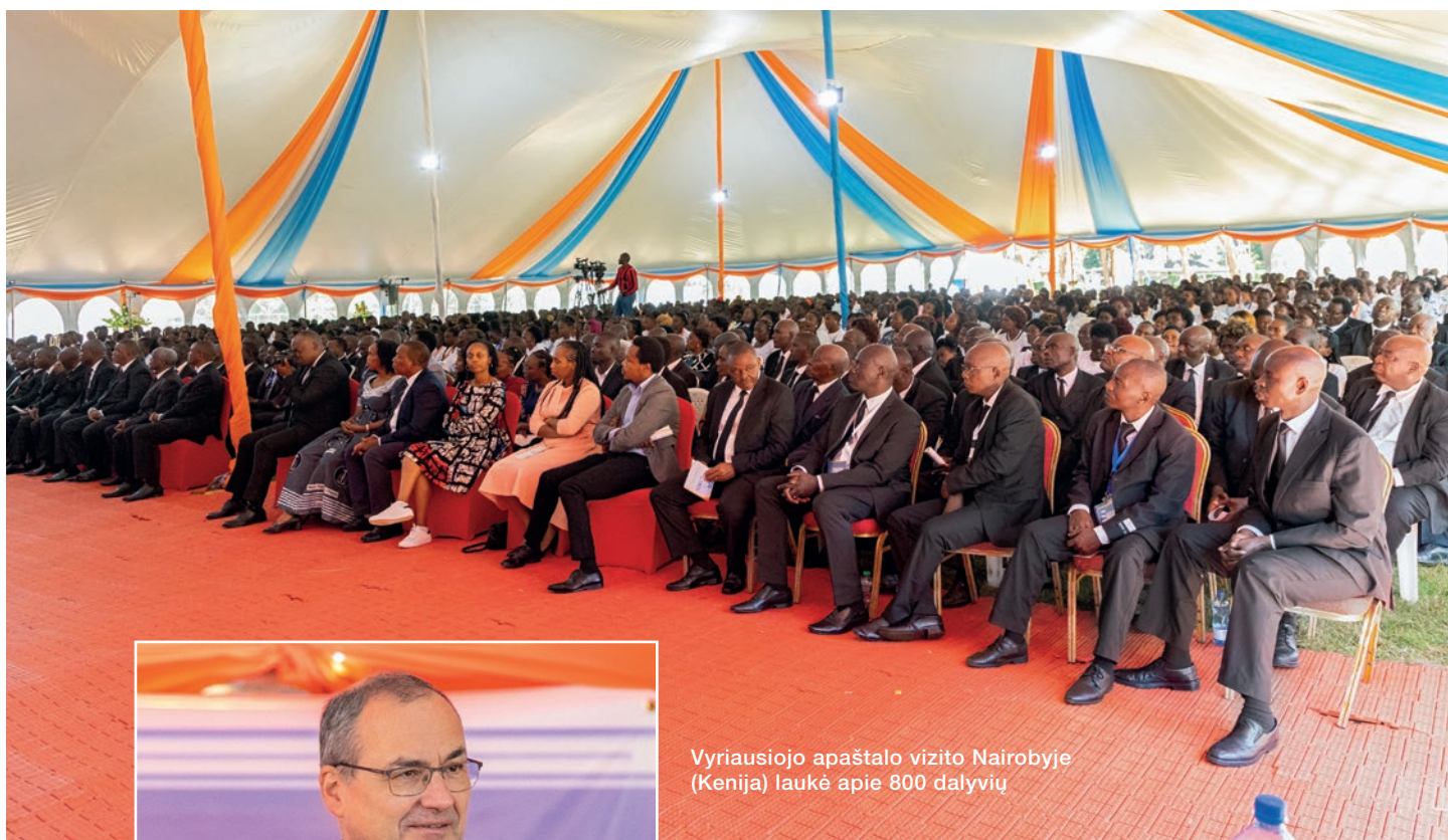
Vyriausiojo apaštalo vizito Nairobyje (Kenija) laukė apie 800 dalyvių