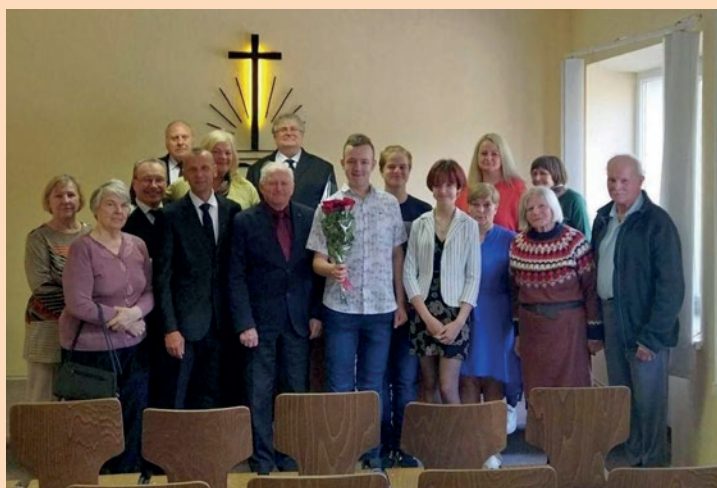
Konfirmacija Kretingos bendruomenėje