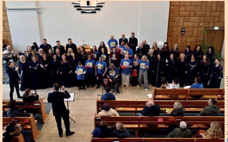
Dainuoja svečiai iš Jorviko ir choras „Cantare“

Jorvik miesto savivaldybės menų ir kultūros mokyklos neįgaliųjų bendruomenė ir Klaipėdos miesto savivaldybės kultūros centro Žvejų rūmų mišrus choras „Cantare“