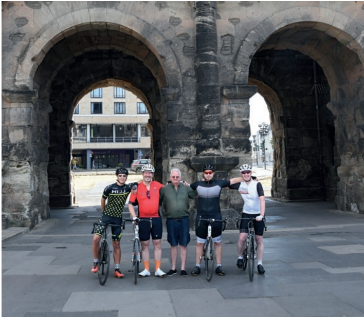
À g. : Devant la Porta Nigra à Trèves (Allemagne) À dr. : Deux cyclistes sur le chemin de Saint-Jacques de Compostelle