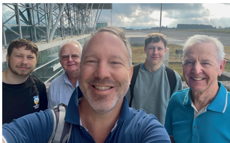
À g. : Au point zéro du chemin de Compostelle À dr. : Fatigués mais heureux, les quatre compères entament le chemin du retour