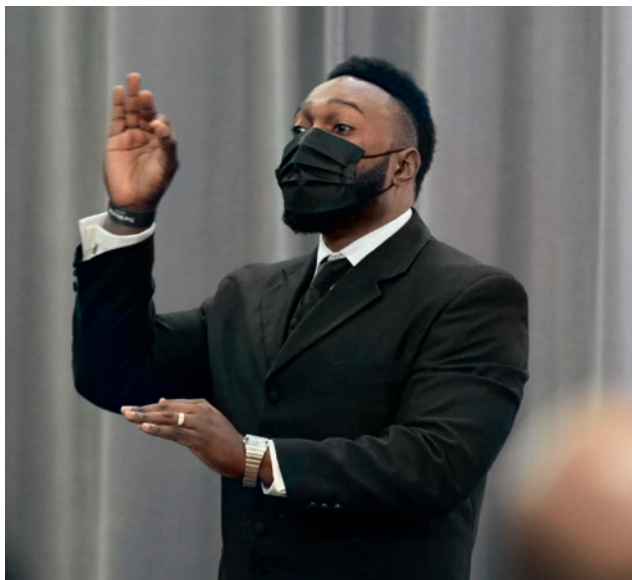
Intarpuose pamaldų dalyvių džiugino choras

Paskutinis punktas, kurį norėčiau įvardinti: jis pasakė, ką turime padaryti, kad patektume į jo karalystę – ir tai nėra Naujosios apaštalų bažnyčios išradimas. Jis sakė, kad norint patekti į jo karalystę, reikia atgimti iš vandens ir Šventosios Dvasios (plg. Jn 3, 3). Norint turėti bendrystę su Dievu Tėvu, Sūnumi ir Šventąja Dvasia, reikia priimti Dievo gyvenimą. Jis taip pat sakė, kad kas nori turėti amžinąjį gyvenimą, turi valgyti jo kūną ir gerti jo kraują (plg. Jn 6, 54-56). Taigi, mes turime švęsti Šventąją Vakarienę. Tie, kurie nori įgyti amžinąjį gyvenimą, turi priimti sakramentus! Mielie broliai ir seserys, tai trumpa apaštalų mokymo santrauka. Senasis Testamentas yra aktualus visada, kai jį siejame su Jėzaus Kristaus mokymu ir suprantame remdamiesi jo žodžiais ir darbais. Jėzus Kristus atėjo ne bausti, o išgelbėti. Jis atėjo ne tam, kad spręstų visas žemiškas problemas ir valdytų visuomenę. Jis atėjo išgelbėti mus nuo piktojo ir įvesti į savo karalystę. Jis triumfavo prieš blogį ir trokšta pasidalinti savo pergale su mumis. Mums tereikia juo pasitikėti, dalytis jo meile, tikėti juo ir išlikti jam ištikimais net tada, kai kenčiame; ir privalome priimti sakramentus.