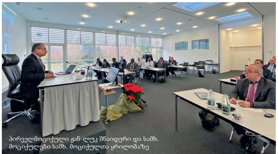
პირველმოციქული ჟან-ლუკ შნაიდერი და სამხ. მოციქულები სამხ. მოციქულთა ყრილობაზე

პირველმოციქული შნაიდერი დიდ დროსა და ძალისხმევას ანდომებს სასულიერო თანამდებობის გაგების თემას და მასთან დაკავშირებულ ქალთა ორდინაციის საკითხს. ეკლესიის მეთაურმა ამასთან დაკავშირებით განაცხადა: „როცა ამ თემაზე ვმუშაობდით, მივხვდით, თუ რაოდენ ვრცელი და ღრმა იგი. უბრალოდ „კის“ ან „არას“ თქმა საკმარისი არ არის. როგორც კონსულტაციებიდან ჩანს, თემა საკმარის მნიშვნელოვანია იმისათვის, რომ იგი დაჩქარებულად და მხოლოდ საზოგადოებრივი ტენდენციების გათვალისწინებით იქნას დამუშავებული.“