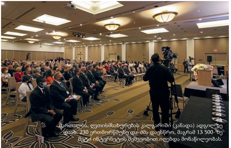
მართალია, ღვთისმსახურებას კალგარიში (კანადა) ადგილზე დაახ. 230 ერთმორწმუნე და-ძმა დაესწრო, მაგრამ 13 500-ზე მეტი ინტერნეტის მეშვეობით იღებდა მონაწილეობას.