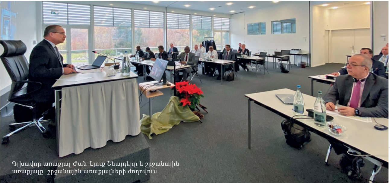
Գլխավոր առաքյալ Ժան-Լյուք Շնայդերը և շրջանային առաքյալը շրջանային առաքյալների ժողովում

Ավարտվեց շրջանային առաքյալների աշնանային ժողովը: Ակնառու թեմաներն էին՝ եկեղեցական պաշտոնի ըմբռնումը, աստվածաշնչյան հեղինակների վերաբերյալ հարցերը և սպասավորների նոր ուղեցույցները: