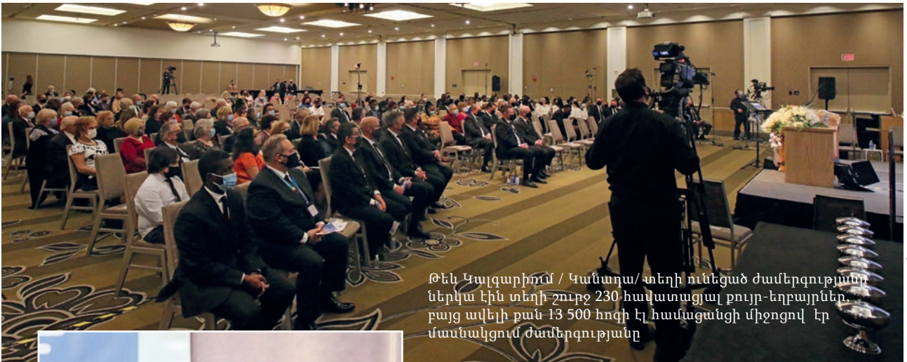
Թեև Կալգարիում / Կանադա/տեղի ունեցած ժամերգությանը ներկա էին տեղի շուրջ 230 հավատացյալ քույր-եղբայրներ, բայց ավելի քան 13 500 հոգի էլ համացանցի միջոցով էր մասնակցում ժամերգությանը