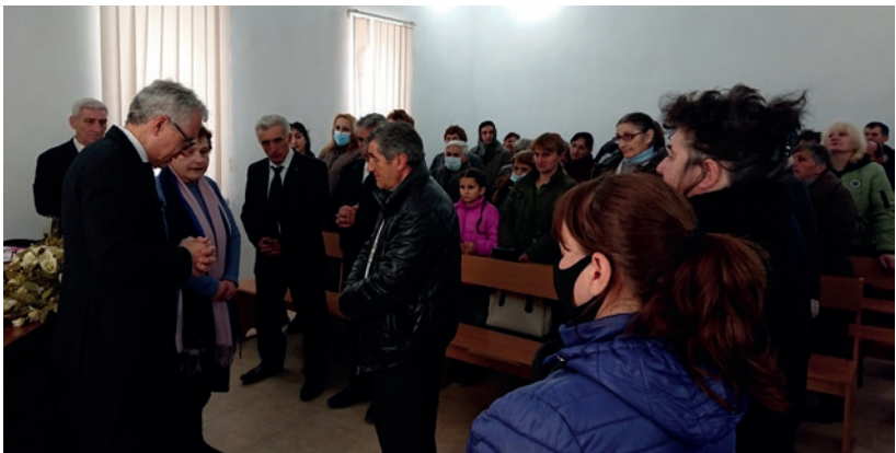
Առաքյալ Շուզը կատարում է ձեռնադրություն

Առաքյալի այցը Հայաստան շատ հազեցած էր: Վանաձորում առաքյալ Շուզը ինտերակտիվ սեմինար անցկացրեց Հայաստանի բոլոր համայնքների սպասավոր եղբայրների մասնակցությամբ: Հարցերի և պատասխանների միջոցով շատ խնդիրներ ու խնդրանքներ պարզաբանվեցին: Բոլոր սպասավորները գոհ էին առաքյալից: Նրանք բարձր գնահատեցին նման սեմինարները, քանի որ դրանք շատ օգտակար են իրենց առաջադրանքների կատարման համար: Առաքյալ Շուզը նաև ձեռնադրություն կատարեց: Նա ձեռնադրեց սարկավազ Վանաձորի համայնքի համար: Առաքյալը խոստացավ, որ հնարավորություն սահմաններում սեմինարներ կկազմակերպի Հայաստանի և Վրաստանի սպասավորների հետ: