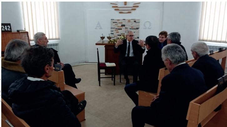
Սպասավոր եղբայրների համար անցկացվող սեմինարի ընթացքում

Կովիդի համավարակը բացասական դեր խաղաց կյանքի բոլոր բնագավառներում, այդ թվում նաև եկեղեցական կյանքում: Համավարակի պատճառով ավելի քան երկու տարի նորառաքելական եկեղեցու Գերմանիայի սպասավորներ եղբայրները չէին կարողանում այցելել Հայաստան: Այդ ընթացքում հայ նորառաքելական եկեղեցու հավատացյալ քույր-եղբայրները ժամանակ առ ժամանակ ժամերգություններ էին ապրում You Tube –ով, սակայն ժամերգությանն անհատապես ներկա գտնվելը բոլորովին այլ է, մասնավորապես, երբ քարոզողը առաքյալ է: Վերջապես լույս երևաց թունելի վերջում, և առաքյալ Վոլֆգանգ Շուզը այցելեց հայ նորառաքելական եկեղեցու հավատացյալներին: Այս տարվա մարտ ամսվա վերջում առաքյալ Շուզը եղավ Հայաստանում, և հայ նորառաքելական եկեղեցու հավատացյալ քույր-եղբայրները առաքյալի հետ ժամերգություններ ապրելու հնարավորություն ունեցան: Առաքյալ Շուզը եղավ Հայաստանի հինգ համայնքներում, / Ալավերդի, Օձուն, Վանաձոր, Գյումրի, Երևան/, սակայն մյուս համայնքների հավատացյալները ևս մասնակցեցին ժամերգություններին, օրինակ, Ստեփանավանի համայնքը եկավ Վանաձոր, Սևանի համայնքը եկավ Երևան: Հավատացյալներն ուշադրությամբ էին լսում առաքյալի