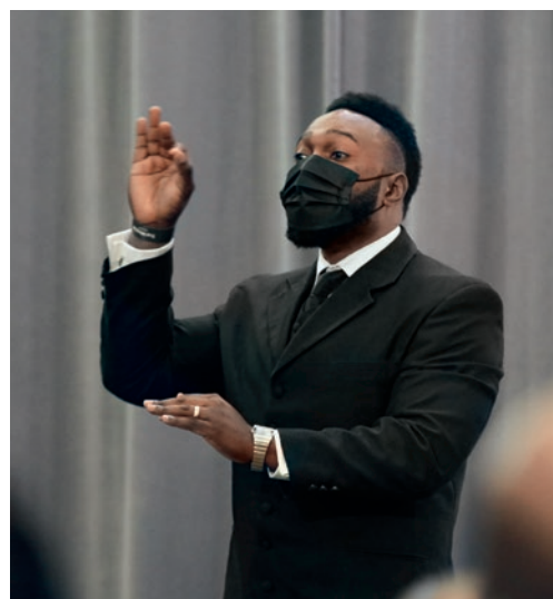
Here pas herë një kor i gëzoi pjesëmarrësit