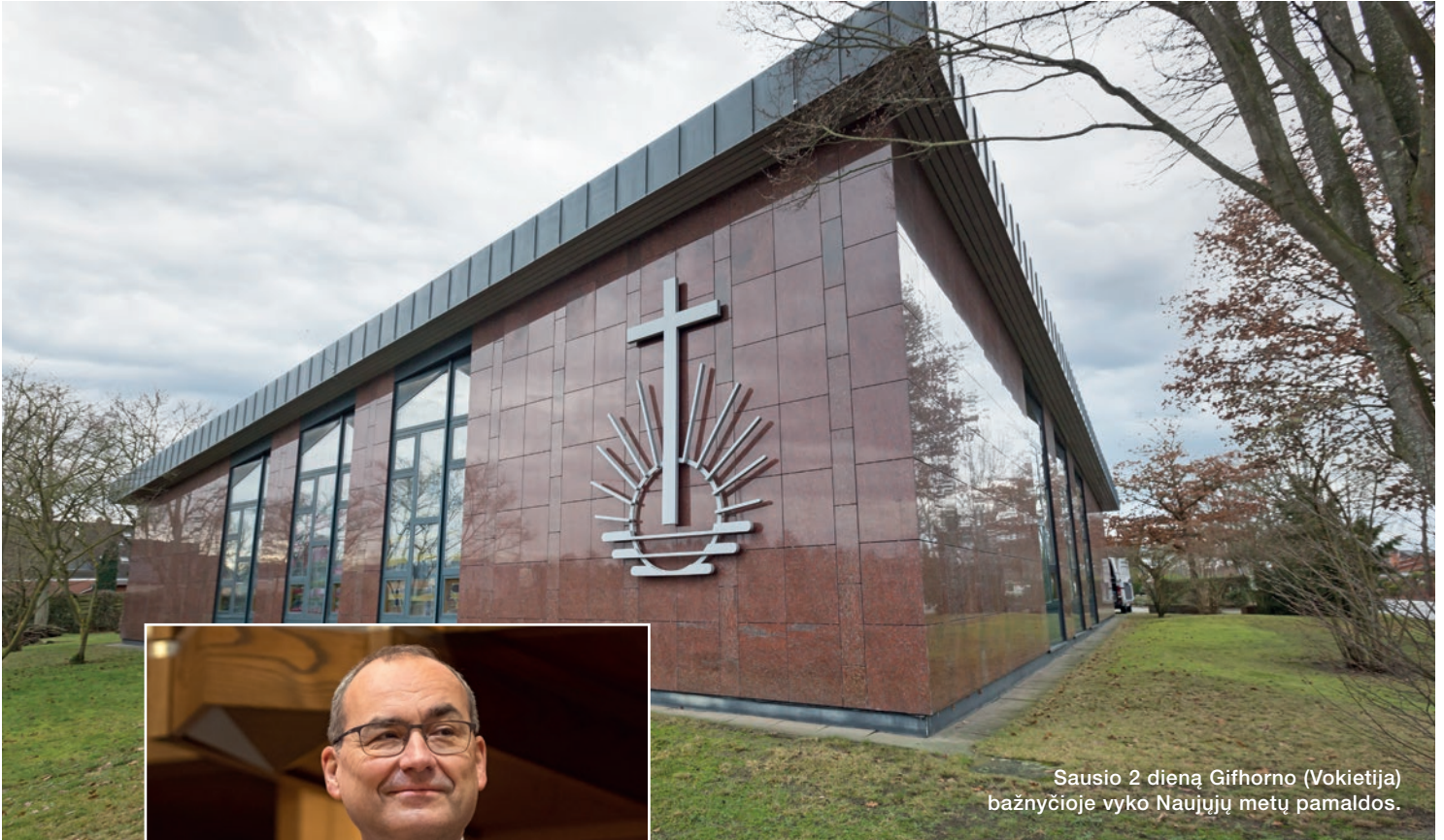
Sausio 2 dieną Gifhorno (Vokietija) bažnyčioje vyko Naujųjų metų pamaldos.