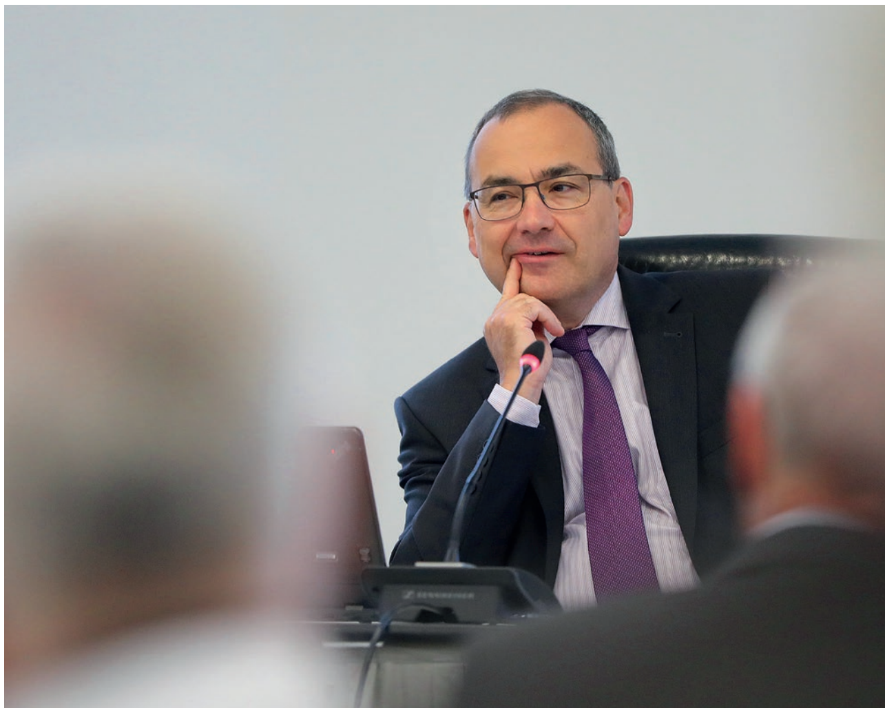
Attēls: Oliver Rütten