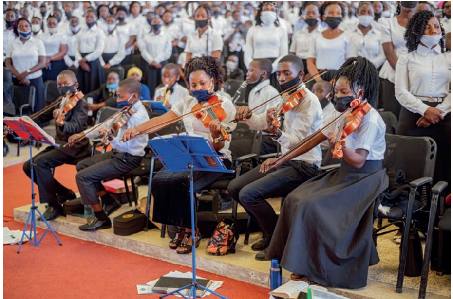
Dievkalpojumu kuplināja koris un mazais stīgu orķestris.