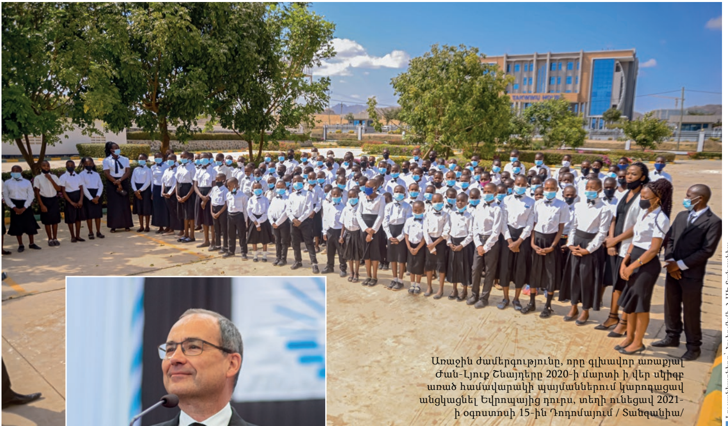
Առաջին ժամերգությունը, որը գլխավոր առաքյալ Ժան-Լյուք Շնայդերը 2020-ի մարտի ի վեր սկիզբ առած համավարակի պայմաններում կարողացավ անցկացնել Եվրոպայից դուրս, տեղի ունեցավ 2021-ի օգոստոսի 15-ին Դոդոմայուն / Տանզանիա/