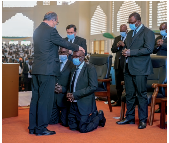
Սուրբ Հաղորդության տոնակատարություն / վերնում/ Գլխավոր առաքյալ Ժան-Լյուք Շնայդերը ձեռնադրում է առաքյալներ Դանիել Օսկո Օխոզոյին և Կոսմաս Բարասա Վանջալային / աջում/

աղոթքը չի լսվել: Իսկ նա ինչպե՞ս է արձագանքել: Երբ մենք գիտակցում ենք դա, կարողանում ենք որոշել, թե ինչպես պետք է վերաբերվենք մեր մերձավորին: