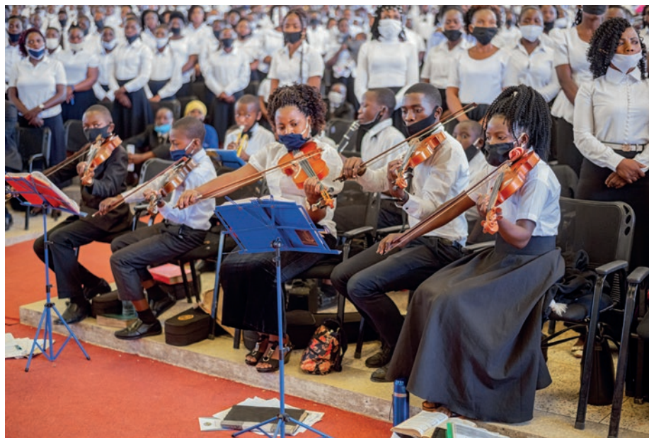
Korri dhe një orkestër e vogël harqesh zbukuruan shërbesën fetare