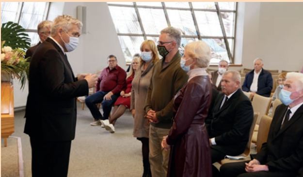
Paženklinimas Šventąją Dvasią