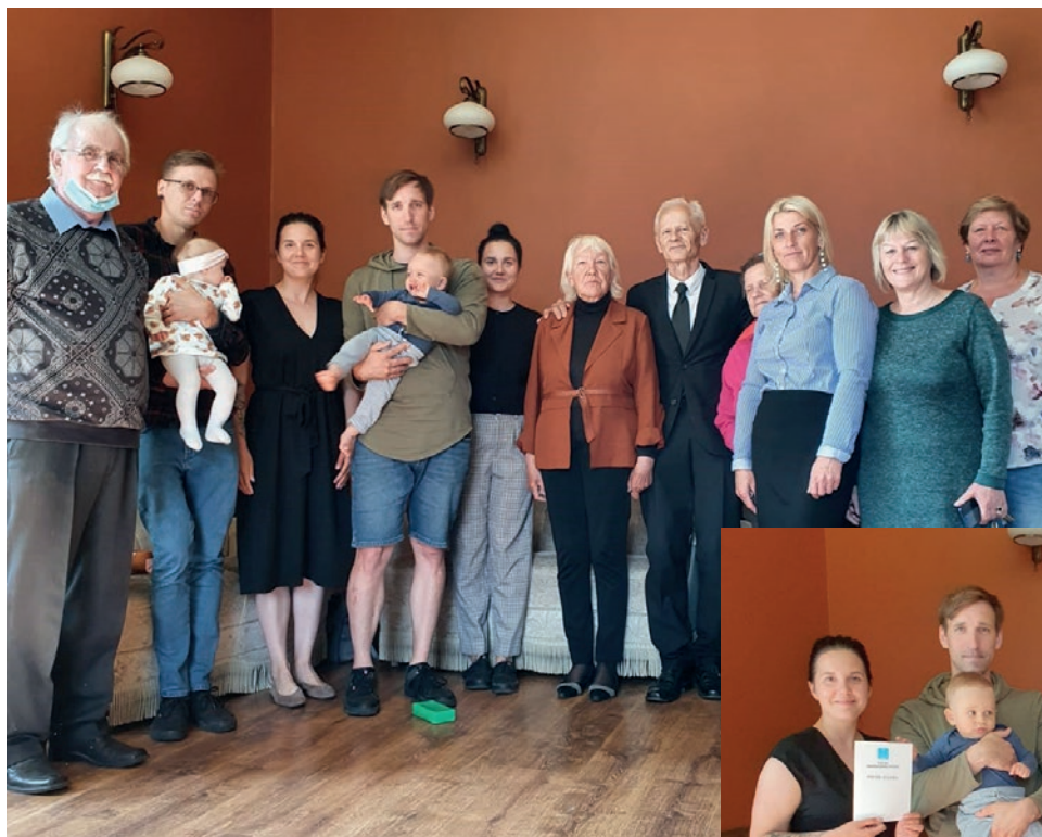
▲ Jaunpils draudzes brāļi un māšas