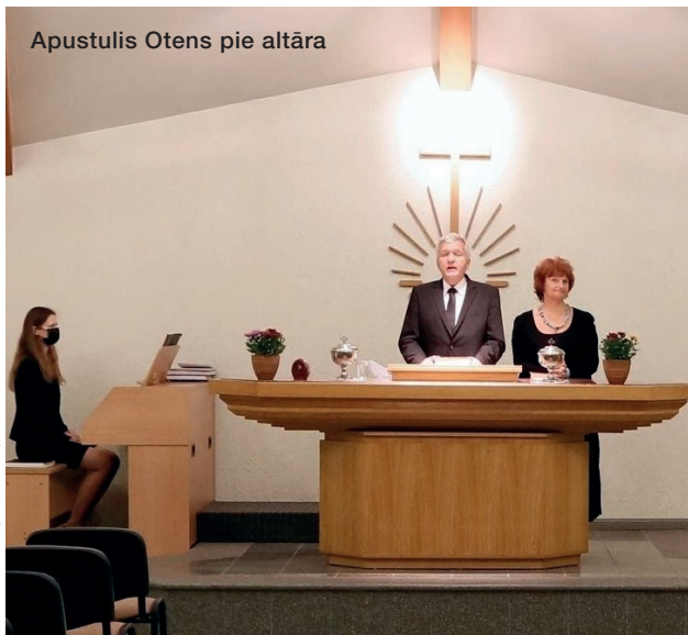
Apustulis Otens pie altāra