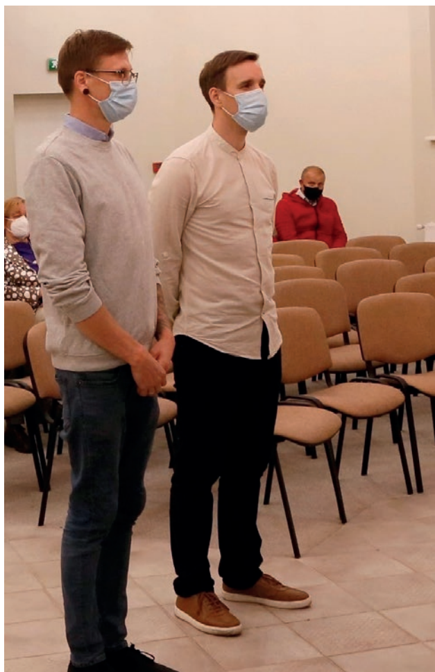
▲ Pirms svētās apzīmogošanas