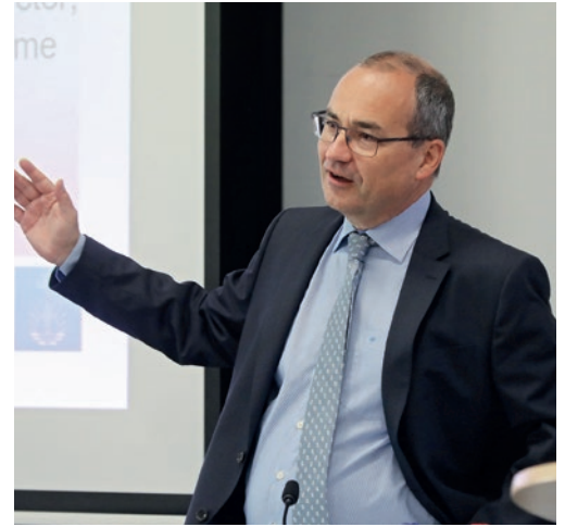
Շրջանային առաքյալները գլխավոր առաքյալի հետ միասին քննարկում են կանանց ձեռնադրության թեման

դիտարկումներ ենք արել, . մեկնաբանում է գլխավոր առաքյալը: Ի՞նչն է Հիսուսին դրդել, որ նա միայն տղամարդկանց կոչ անի առաքյալների սպասավորության: Կամ ի՞նչ է այդ մասին վաղ շրջանի եկեղեցին ասում Նոր կատակարանում, օրինակ, հովվական նամակներում: