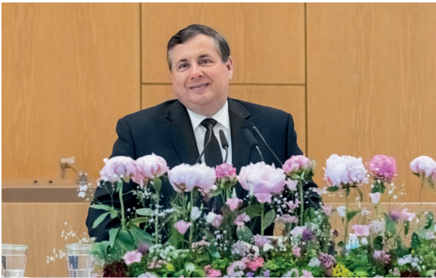
Շրջանային առաքյալ Միխայել Դեփփներ / ձախում՝ Կոնգայի Դեմոկրատական Հանրապետություն – Արևմուտք/ և շրջանային առաքյալ Լեոնարդ Ռ. Քոլբ / աջում՝ ԱՄՆ/ լրացնում են գլխավոր առաքյալի քարոզը: