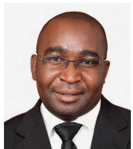
მოციქული ბეიკერ ჩაკვანა