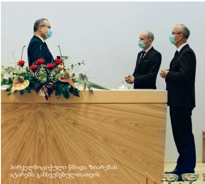
პირველმოციქული წმიდა ზიარებას ატარებს განსვენებულთათვის

საკუთარი ინტერესები გამოდის. ზოგიერთებში იმდენად დიდი ხდება „მე“, რომ უეცრად იესო პატარავდება. „მე“ იმდენად დიდი ხდება, რომ „ჩვენ“ სრულიად ავიწყდებათ. ეს სხვადასხვა შედეგებს იწვევს, რაც მე საფიქრალს მიჩენს.