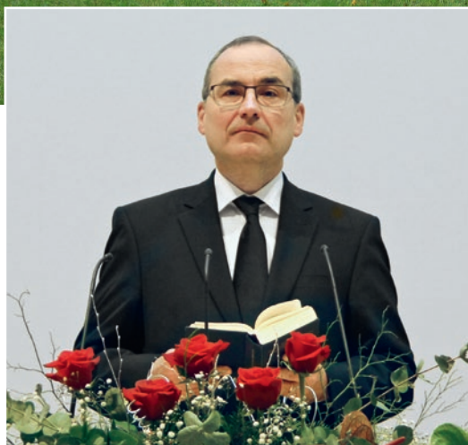
ებრ. 12, 1. 2

„მოთმინებით გავლით ჩვენს წინაშე მდებარე სარბიელი. თვალი მივაპყროთ იესოს, რწმენის წინამძღვარსა და სრულმყოფს.“