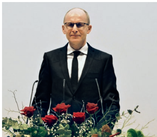
ეპისკოპოსი რუდოლფ ფესლერი (შვეიცარია)

მაშ მოდით, თვალი მივაპყროთ იესო ქრისტეს და არა იმდენად ჩვენს მიღწევებს. ის არის ჩვენი რწმენის „სრულმყოფი“. და თუ მხოლოდ იმაზე ვიფიქრებთ, თუ რა წარმატებებს ვაღწევთ, რას ვიმსახურებთ და რას ვწირავთ, ამას ვერ შეძლებთ.