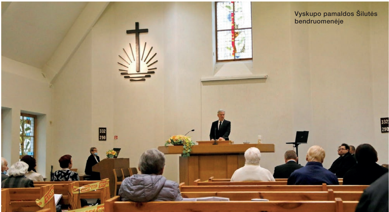
Vyskupo pamaldos Šilutės bendruomenėje