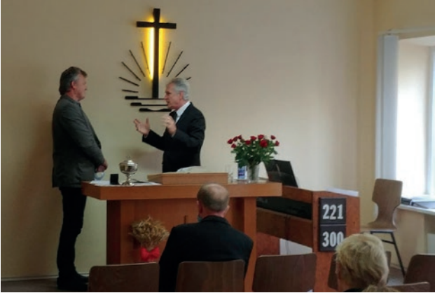
Vyskupas A. Strelčiūnas laiko pamaldas Kretingos NAB bendruomenėje