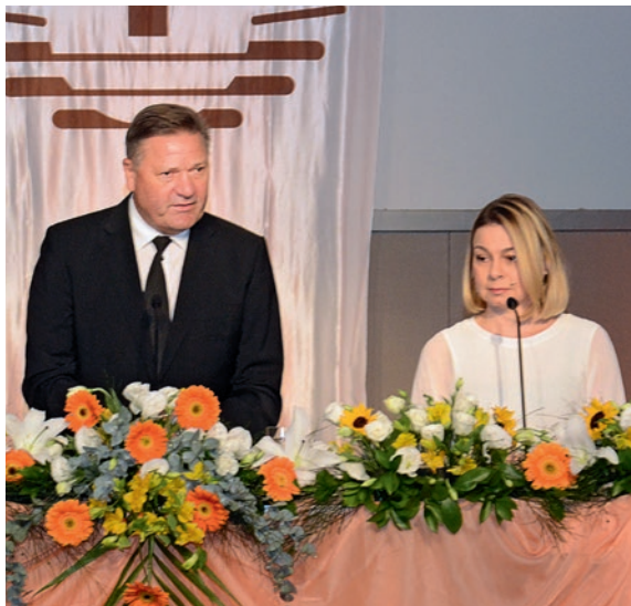
Krašto apaštalas Rainer Storck (Vakarų Vokietija)