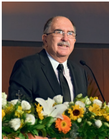
Krašto apaštalas Raul Montes de Oca