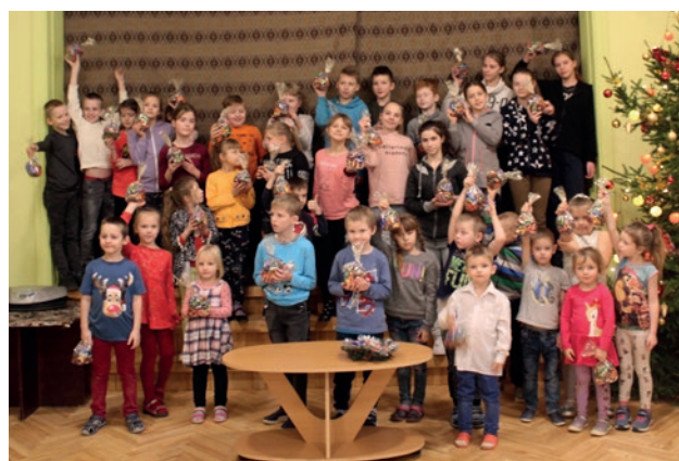
Cēres skolas bērniņi ar saldumu paciņām rokās

Pēc dievkalpojuma jauniešu ansamblis nodziedāja dziesmu par godu Dievam un Viņa Dēlam Jēzum Kristum. Bērniņi saņēma gaidītās saldumu paciņas, kuras finansiāli atbalstīja brāļi un māšas Vācijas draudzēs, bet pašas paciņas sagatavoja Siguldas draudzes māšas.