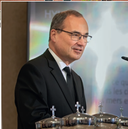
Աստվածաշնչյան խոսք՝ Սաղմոս 135,6

Տերն ինչ որ ցանկացավ, կատարեց երկնքում և երկրի վրա, ծովում և բոլոր անդունդներում: