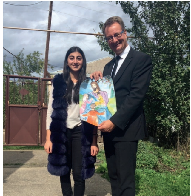
Ստեփանավանի համայնքի կիրակնօրյա դպրոցի աշակերտուհին առաքյալին նվիրեց իր կողմից նկարված մի նկար, որը, ի դեպ, վերաբերում էր տվյալ ժամերգության աստվածաշնչյան խոսքին, երբ Հիսուսն իր մոտ է կանչել տալիս երեխաներին: Առաքյալը նախապես չգիտեր, որ հենց այդ բովանդակությամբ նկար է նվեր ստանալու:

Այն բանից հետո, երբ առաքյալ Վիլիելմ Հոյերը առաքելական երկարամյա ծառայությունից հետո ուղարկվեց հանգստի, Հայաստանի Նորառաքելական եկեղեցին ունեցավ նոր առաքյալ հանձնիս առաքյալ Յենս Լինդեմաննի, ով միաժամանակ առաքյալի ծառայություն է իրականացում շատ այլ երկրներում: Առաքյալ Լինդեմանն արդեն երկրորդ անգամ է լինում Հայաստանում: Առաջին անգամ նա եկել էր շրջանային առաքյալ Ռայներ Եթորքի և առաքյալներ Վիլիելմ Հոյերի ու Պավել Գամովի ուղեկցությամբ: Շրջանային առաքյալ Ռայներ Եթորքը Հայաստանի հավատացյալ քույր-եղբայրներին ծանոթացրեց առաքյալ Լինդեմաննի հետ: Այդ ժամանակ առաքյալ Լինդեմանը ժամերգություններ անց չկացրեց :