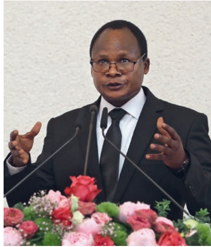
Apostuli i distriktit Kububa Soko (Zambia, Malawi, Simbabwe)