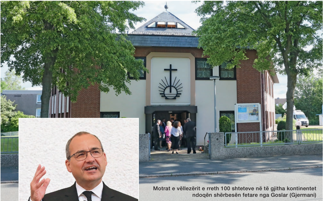
Motrat e vëllezërit e rreth 100 shteteve në të gjitha kontinentet ndoqën shërbesën fetare nga Goslar (Gjermani)