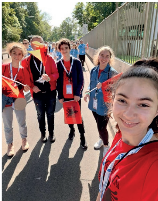
Te rinj shqiptarë me flamuj në duar