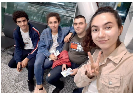
Të rinjtë nga Lushnja