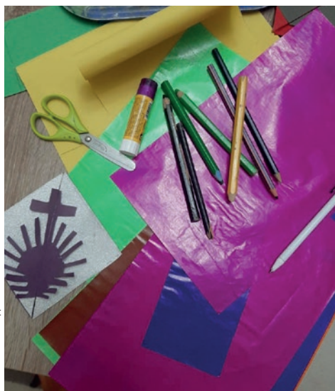
Pashaportat e udhëtimit