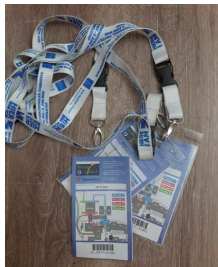
Pashaportat e hyrjes