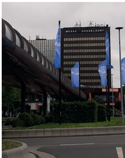
Pamje nga ekspozita Düsseldorf