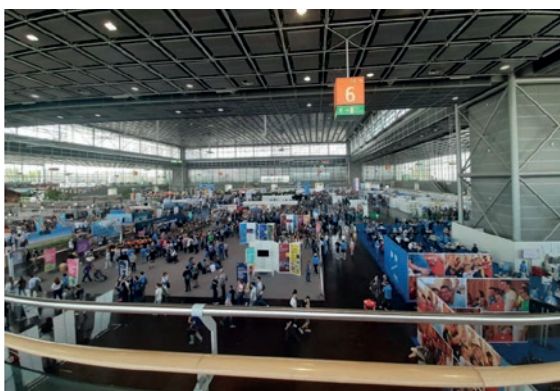
Salla 6 e ekspozitës