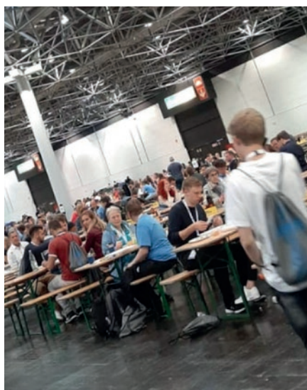
Salla e ngrënies dhe fjetjes