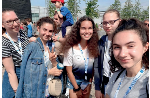
Te rinj nga Shqipëria dhe Krefeld-i

Kjo ngjarje ka lënë mbresa në mendjet tona dhe është e pamundur mos ta kujtosim në çdo moment.