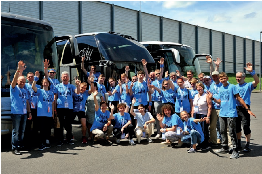
Lietuvos delegacija Tarptautinėse jaunimo dienose Lietuvos stendas