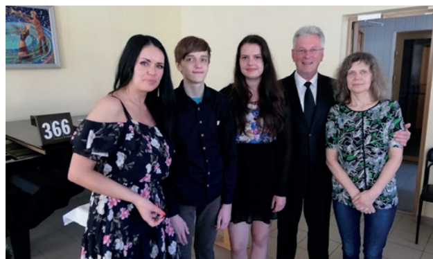
Rokiškio bendruomenės konfirmantai