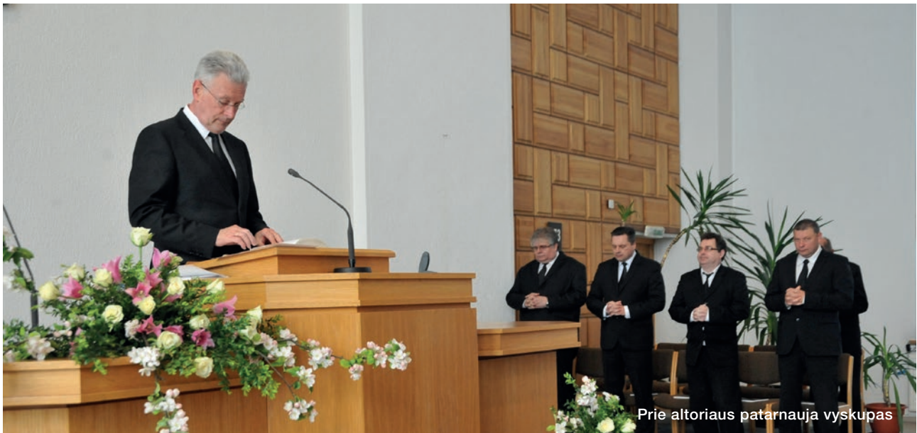
Prie altoriaus patarnauja vyskupas