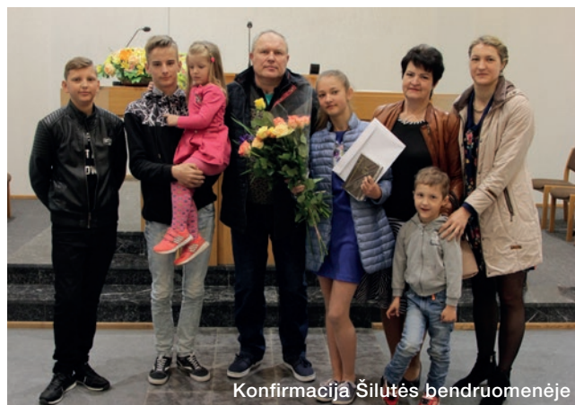
Konfirmacija Šilutės bendruomenėje