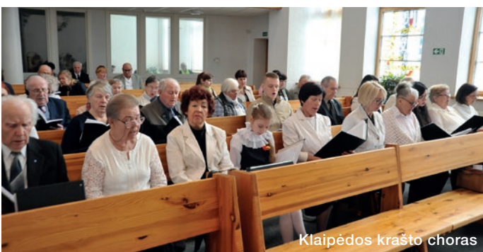
Klaipėdos krašto choras

Pamaldose dalyvavo tikintieji iš N. Akmenės, Šiaulių, Šilutės, Kretingos, Palangos, Pakruojo ir Radviliškio bendruomenių.