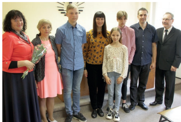
Konfirmacija Kretingos bendruomenėje

Sveikiname visus šešis konfirmantus vyriausiojo apaštalo žodžiais: „Mes esame dėkingi, kad esate šalia mūsų, kad kartu tarnautume Viešpačiui! Jūs mums daug reiškiate – o Dievui jūs reiškiate dar daugiau!“