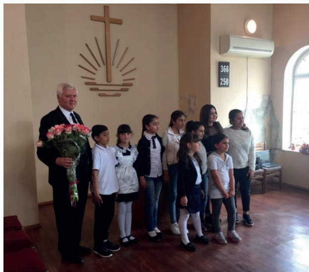
Առաքյալը Գյումրիի համայնքի մանկական երգչախմբի երեխաների հետ

Մայիս ամսին Հայաստան այցելեց առաքյալ Պավել Գամովը: Նրան ուղեկցում էին կինն ու դուստրը: Առաքյալի պաշտոնում դա նրա վերջին այցն էր, քանի որ հունիս ամսվա վերջին նա անցնելու է հանգստի: Հայաստանի նորառաքելական եկեղեցու բոլոր անդամները մի կողմից տխուր էին, քանի որ նույն ժամանակահատվածում հրաժեշտ են տալիս երկու առաքյալների / Վիլիելմ Հոյերին և Պավել գամովին/, որոնք երկար տարիներ հոգու խնամքի աշխատանք են տարել Հայաստանում, մյուս կողմից էլ ուրախ են, որ ունեն նոր առաքյալ ի դեմս Յենս Լինդեմանի: Հայաստանի նորառաքելական երեղեցու բոլոր քույր-եղբայրները շատ շնորհակալ են առաքյալ Պավել Գամովին, որ նա այդ տարիների ընթացքում իր քարոզների միջոցով ուժեղացրել է նրանց հավատը: Յուրաքանչյուր ժամերգության ավարտին առաքյալը հաճույքով պատասխանում էր քույր-եղբայրների բոլոր հարցերին: Այս անգամ ևս նա ժամերգություններ անցկացրեց Հայաստանի բոլոր համայնքներում: Բոլոր քույր-եղբայրները ուշադիր լսում էին նրան ու շնորհակալություն հայտնում երկար տարիների ծառայության համար: Նրանք շնորհակալություն էին հայտնում նաև նրա կնոջն ու դստերը, որ նրանք եկել են Հայաստան՝ նաև իրենց տեսնելու: Առաքյալի կինն ու դուստրը շատ գոհ էին, որ ծանոթացել են նման հավատացյալ քույր-եղբայրների հետ: Յուրաքանչյուր համայնքում