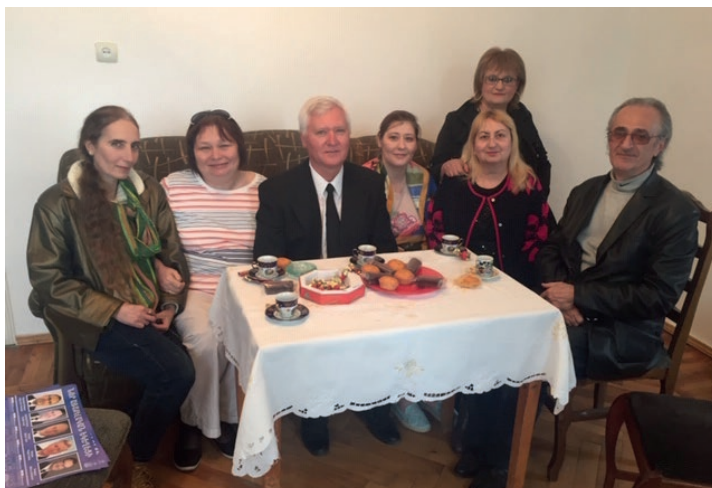
Առաքյալը Սևանի համայնքում է