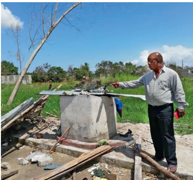
Առաքյալ Ագոստինո Ալբինո Դզիմբան Մաֆաբինայի ավերված եկեղեցում / Մոզամբիկ/, որտեղ միայն զոհասեղանն է դիմակայել փոթորկին:

Այս առումով մեծ աշխատանք է կատարում ՆԱԵ- քարեգործականը Նորառաքելական եկեղեցու օգնող կազմակերպության , ինչպես նաև „Օգնիր՝ ինքդ քեզ օգնելու համար, կազմակերպության հետ միասին: Օգնող կազմակերպությունը ֆինանսական օգնությունը ստանում է ոչ միայն ընթացիկ նվիրատվություններից, այլ նաև Հարավային Գերմանիայի, նորառաքելական „հուման ակտիվ, քույր կազմակերպության կողմից՝ 50 000 եվրո օժանդակությամբ: 30 000 ֆրանկ տրվում է ուղիղ Կարմիր խաչի կողմից, այլոց հետ օգնողների թվում է „ՆԱԵ- մարդասիրականը,,: