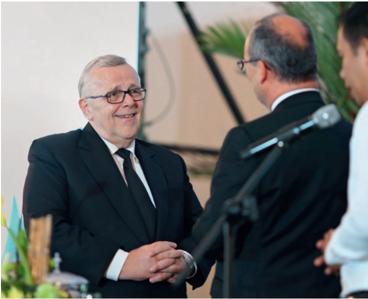
Շրջանային առաքյալ Ուրս Հեբայգենը /Հարավ-Արևելյան Ասիա/ անցնում է հանգստի – 36 տարվա առաքյալի պաշտոնում ծառայելուց հետո: Հրաժեշտին գլխավոր առաքյալ Ժան-Լյուք Շնայդերը բնա գործունեությունը բնութագրեց երեք հասկացությամբ՝ եռանք, սեր և հավատարմություն Աստծուն: