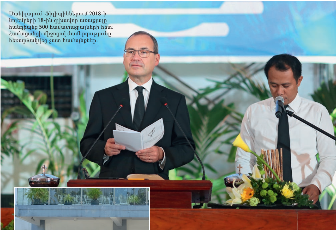
Լուսանկարում՝ Հարավ-Արևելյան Ասիայի ՆԱԵ

Մանիլայում, Ֆիլիպիններում 2018-ի նոյեմբերի 18-ին գլխավոր առաքյալը հանդիպեց 500 հավատացյալների հետ: Համացանցի միջոցով ժամերգությունը հեռարձակվեց շատ համայնքներ: