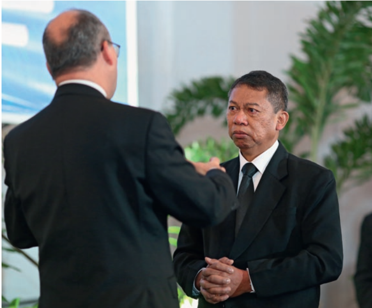
Շատ երկրներ, շատ ժողովուրդներ, շատ մշակույթներ: Հեշտ առաջադրանք չէ այն, որն ընդունում է Էդի Բսնուգրոհոն՝ որպես նոր շրջանային առաքյալ Հարավ-Արևելյան Ասիայում: Թե ինչպես կարելի է այն հաջողել, առաջադրանքը տալիս ասաց գլխավոր առաքյալը:

Մի վերջին կետ էլ կա: Ատլետը չի որոշում, թե երբ է տեղի ունենալու մրցույթը: Նա չի կարող ասել., Օ, ոչ, ոչ այսօր: Ես լավ տրամադրություն չունեմ, ավելի լավ է թողնենք, որ Օլիմպիական խաղերը սկսվեն վաղը.,: Ինչ որ մեկը ամրագրում է մրցույթի սկիզբը և պետք է դրան պատրաստ լինել: