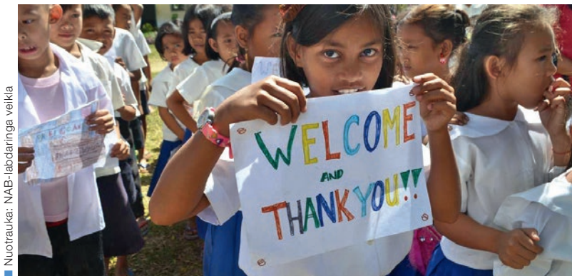
Nuotrauka: NAB-labdaringa veikla

Apie 4 milijonai eurų už 100 projektų 24-iose šalyse: toks yra 2017-ų metų paramos organizacijos NAB-labdaringa veikla balansas. Kokie likimai slepiasi už šių skaičių, atskleidžia neseniai publikuota metinė ataskaita.