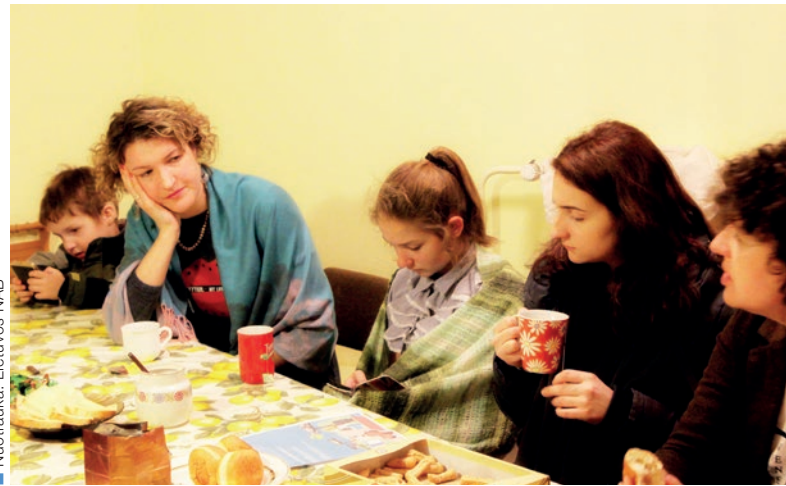
Diskusijoje gimsta idėjos