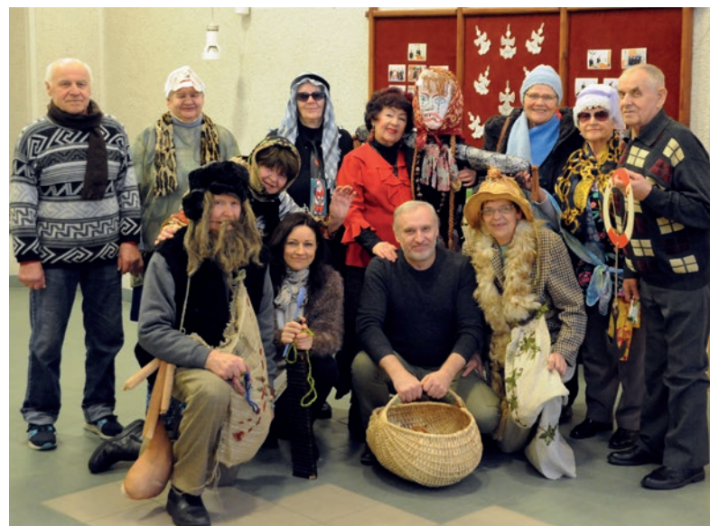
Bendra nuotrauka atminčiai

Klaipėdos NAB bendruomenės senjorai kovo mėnesį paruošė Užgavėnių popietę, kur linksmai išlydėjo "žiemą iš kiemo", vaišinosi blynais, šmaikštavo. Tai vienas iš jau tradicinių tapusių renginių, kaip kalėdiniai pasisėdėjimai, poezijos popietės, išvykos. Linksmai bei įdomiai bendrauja ir N. Akmenės senjorai, kurie kartu su Šiaulių bendraamžiais susitinka ir su kitomis bendruomenėmis. Įdomi ir įspūdinga buvo Lietuvos vakarų regiono senjorų ekskursija į Pakruojį.