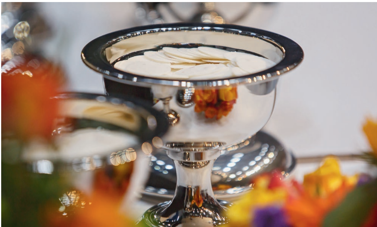
Attēls: Marcel Felde

Nobeigumā es vēl vēlos dot šādu padomu: mēs vēlamies veidot attiecības ar citiem kristiešiem atbilstoši apustuļa Pāvila vārdiem: „Tad nu važās slēgts sava Kunga dēļ, es jūs mudinu: dzīvojiet tā, kā to prasa jūsu aicinājuma cieņa, visā pazemībā, lēnībā un pacietībā, cits citu panesdami mīlestībā, cenšamies uzturēt gara vienotību ar miera saiti.” (Efeziešiem 4, 1-3)