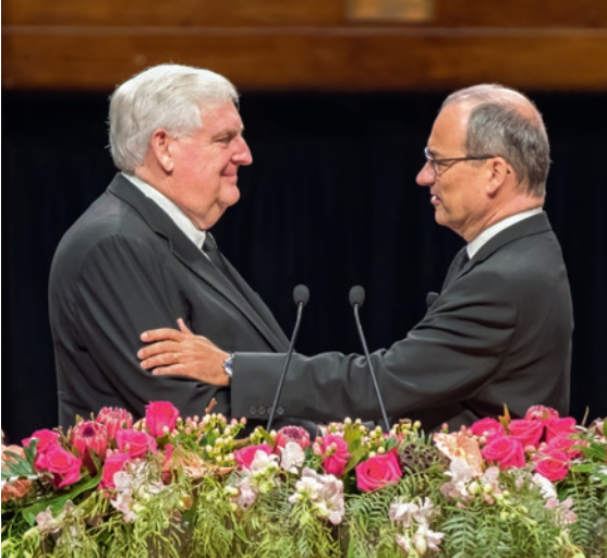
ფოტო: ავსტრალიის აბსე, სამხრეთ-აღმოსავლეთ აზიის აბსე