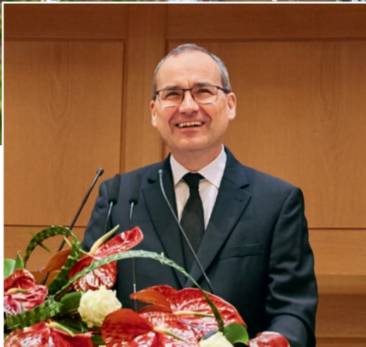
Կորնթացիներին Ա 1,5-7

„ ...որովհետև ամեն բանի մեջ դուք նրանով հարստացաք՝ ամեն խոսքով և ամենայն գիտությամբ, ինչպես որ Աստծո վկայությունն իսկ հաստատվեց մեր մեջ: Դուք պակաս չլինեք և ոչ մի շնորհից՝ սպասելով մեր Տեր Հիսուս Քրիստոսի հայտնությանը,,: