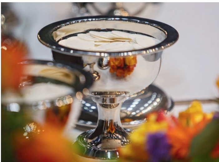
Առաքյալը՝ Մարտի Ֆեդրեի

Աստված Քրիստոսի եկեղեցին սպառազինում է այն շնորհներով, որի կարիքը նա ունի: Նա ջրով և Հոգով վերստին ծնվածներից, նաև ջրով մկրտվածներից ընտրում է եկեղեցու մի քանի անդամներ, որպեսզի նրանց վստահի հատուկ շնորհներ, ինչպես օրինակ՝ ավետարանականացման շնորհը,