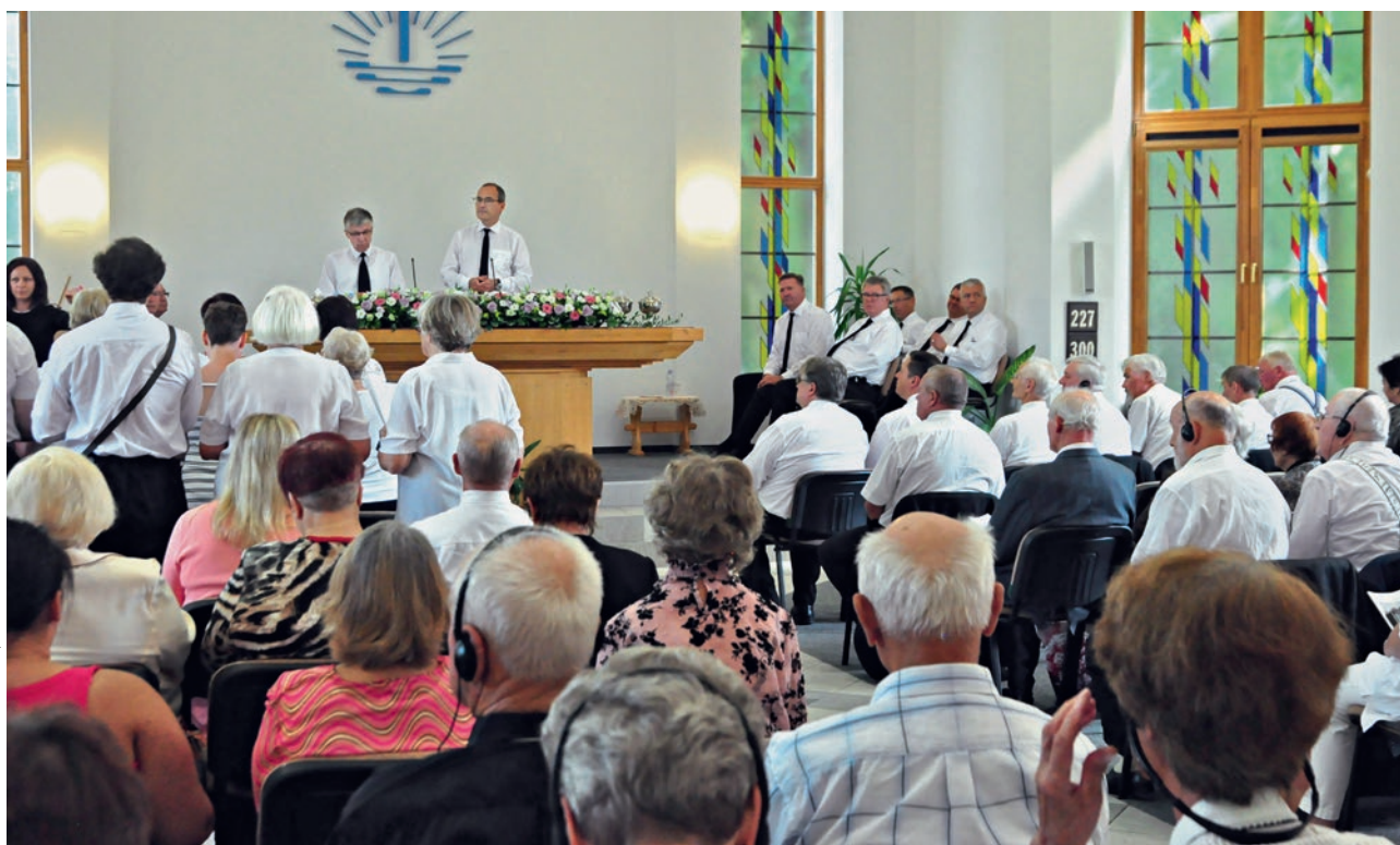
Attēls: Lietuvas Jaunapustuliskā baznīca