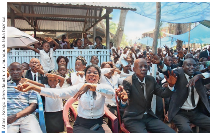
Attēls: Kongo dienvidaustrumu Jaunapostuliskā baznīca