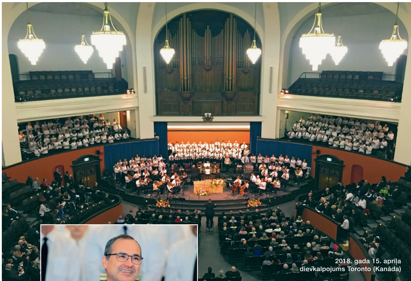
Attēls: Kanādas Jaunapustuliskā baznīca

2018. gada 15. aprīļa dievkalpojums Toronto (Kanāda)