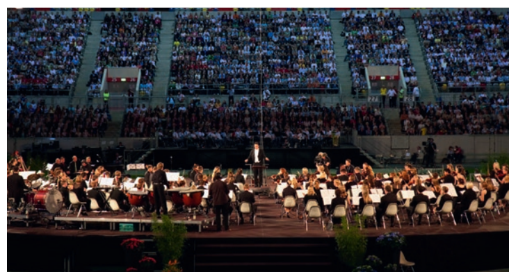
Attēli, kuri drīz parādīsies: Eiropas Jauniešu diena 2009, kam sekos SJD 2019

Iedziļinoties idejās, projektgrupu dalībnieki vēl ilgi diskutēja, taču troksnis un nemiers foajē pārtrauca to darbu. Jaunie cilvēki traucās uz priekštelpu garām lielām kastēm ar traukiem, augļiem un siltumtraukiem - bija