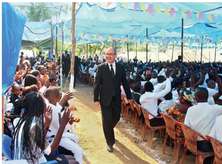
ფოტო: კონგოს დემოკრატიული რესპუბლიკის ახსე (სამხრეთ-აღმოსავლეთი)

ცხადია, თუ რა უნდა ვაკეთოთ: სიკეთე. ცხადია ისიც, თუ ვის უნდა გავუკეთოთ სიკეთე: მოყვასს. მაგრამ: მერედა რატომ? შედეგის მისაღებად მოტივაციას გადამწყვეტი მნიშვნელობა აქვს. ხუთი კარგი და ხუთიც ნაკლებად კარგი მიზეზი პირველმოციქულის ღვთისმსახურებიდან, რომელიც 2018 წლის 21 ივლისს კინდუში (კონგოს დრ) ჩატარდა.