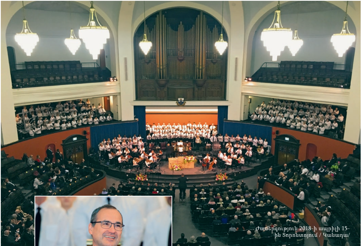
Ժամերգություն 2018-ի ապրիլի 15-ին Տորոնտոյում / Կանադա/