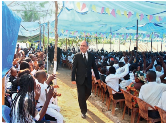
Լուսավորող, ԵՄԱ Կոնգոյի ԴՀ Հարավ-Արևելք

Պարզ է, թե ինչ պետք է արվի՝ բարին: Պարզ է նաև, թե ում պետք է դա արվի՝ մերձավորին: Բայց ընդհանրապես ինչու: Մոտիվացիան շատ վճռորոշ է արդյունքի համար: Հինգ լավ և հինգ քիչ լավ պատճառ 2018-ի հուլիսի 21-ի Կինդույում /Կոնգոյի Դեմոկրատական Հնարապետություն/ գլխավորի առաքյալի հետ տեղի ունեցած ժամերգությունից: