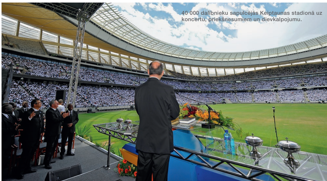
40 000 dalībnieku sapulcējās Keiptaunas stadionā uz koncertu, priekšnesumiem un dievkalpojumu.

cilvēka viedokļa, viņam bija jāiet pa ūdens virsu. Taču Jēzus teica Pēterim: „Nāc!” Pēterim bija jādara tas, ko teica Jēzus, viņam bija jāseko Tā piemēram.