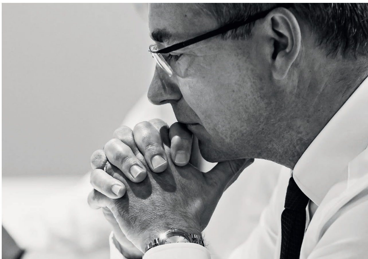
Attēls: Marcel Felde