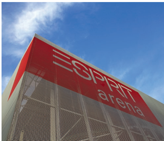
Attēls: Oliver Rütten

Programmas daudzveidība: tik daudz jau ir skaidrs par Jaunapustuliskās baznīcas 2019. gada Starptautisko jauniešu dienu. Bet tēmu saraksts un termiņu kalendārs vēl tiks papildināts.