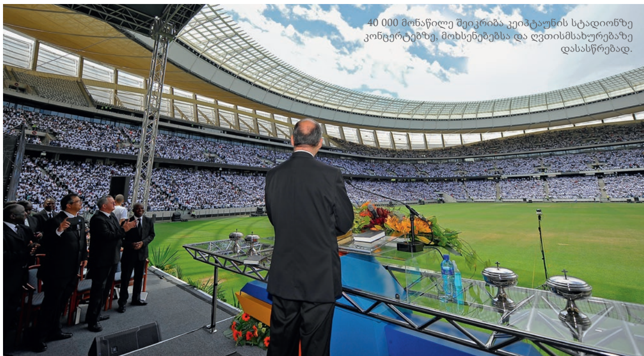
40 000 მონაწილე შეიკრიბა კვიპტაუნის სტადიონზე კონცერტზე, მოხსენებებსა და ღვთისმსახურებაზე დასასწრებად.

მოყოლებული ღმერთი უხმობს ადამიანებს, ყველა ადამიანს: „მოდით ჩემთან, გთხოვ. მინდა ჩემთან საუკუნო თანაზიარებაში შემოგვიყვანო.“ ღვთის მოწოდება კაცობრიობის მიმართ ასეთია: „გთხოვ, მოდი!“ ეს ზოგადო მოწოდება კი არ არის, არამედ პიროვნულია. ღმერთი თვითუფლებს ცალკე უხმობს: „მოდით ჩემთან.“ ეს ძახილი ჩვენც გვეხება: ძმაო, დაო, მოდი იესოსთან. მას სურს, რომ შენც და მეც თავისთან საუკუნო თანაზიარებაში შეგვიყვანოს.