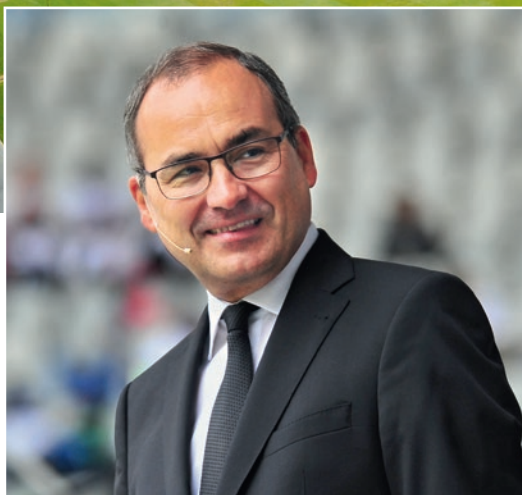
მათ. 14, 29

„უთხრა: ‘მოდით!’ პეტრე გადმოვიდა ნავიდან და წყალდაწყალ წავიდა, რათა იესოსთან მისულიყო.“