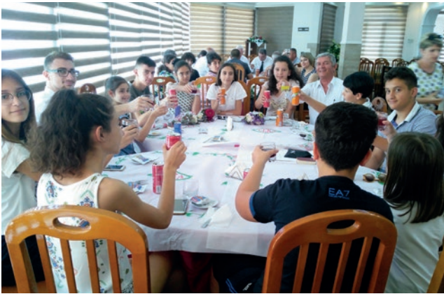
Konfirmantët dhe familjarët e tyre në drekën e dhënë për ta

fund të shërbesës të gjithë pjesëmarrësit kënduan sëbashku këngën Nuk rroj unë dot pa ty.