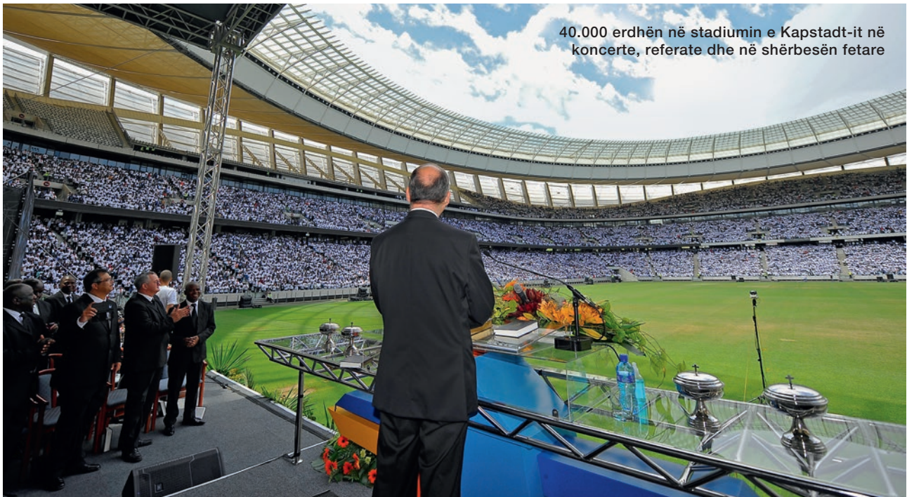
40.000 erdhën në stadiumin e Kapstadt-it në koncerte, referate dhe në shërbesën fetare

Sot Jezusi na thërret ne: Eja, dua pikërisht këtu dhe tani të bashkohem me ty. Ose, po ta shpreh me fjalët e motos së sotme: „Eja, dua të jetoj dhe punoj brenda jush.“ Më lejoni të jem pjesë e jetës suaj. Ndajini mendimet dhe jetën tuaj me mua. Ejani më pranë.