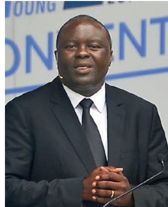
Apostoli i distriktit Tshitshi Tshisekedi (RD e Kongos)