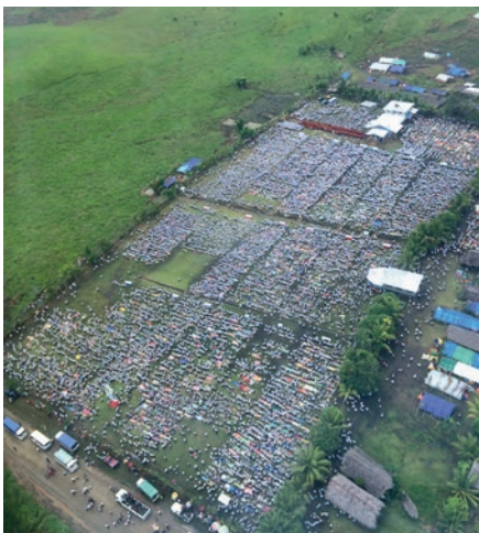
Պապուա Նոր Գվինեայում ժամերգությանը մասնակցում էր ավելի քան 24. 000 մասնակից: