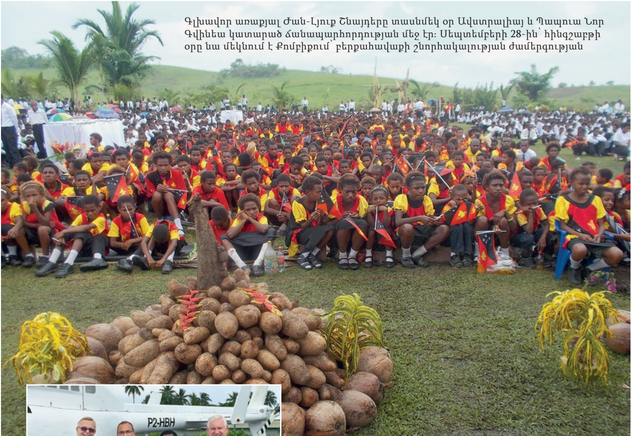
Գլխավոր առաքյալ Ժան-Լյուք Շնայդերը տասնմեկ օր Ավստրալիայ և Պապուա Նոր Գվինեա կատարած ճանապարհորդության մեջ էր: Սեպտեմբերի 28-ին՝ հինգշաբթի օրը նա մեկնում է Քոմբիբում՝ բերքահավաքի շնորհակալության ժամերգության