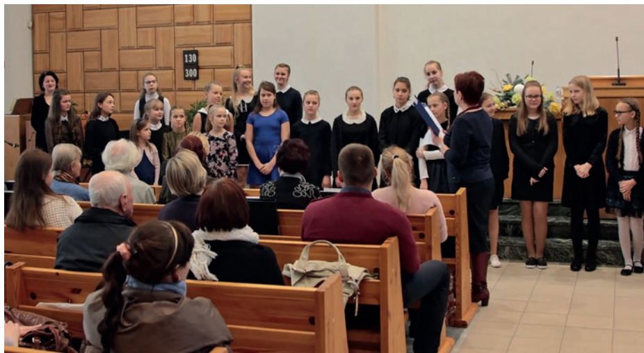
Nuotrauka: Lietuvos NAB