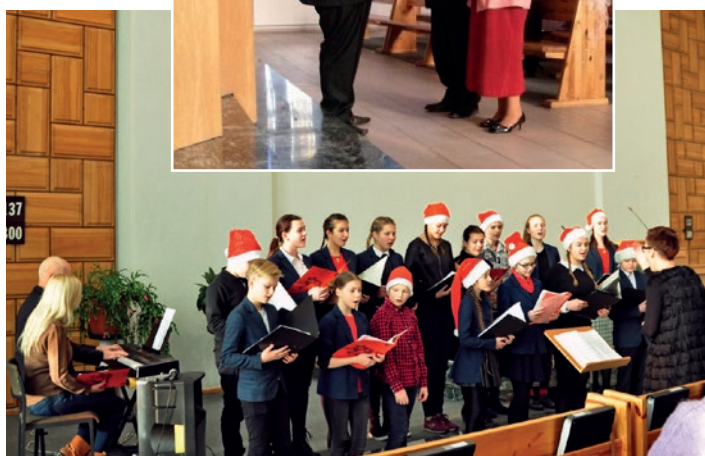
Dainuoja mokinių choras