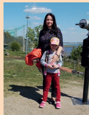
Iškylautojai Ventės Rage