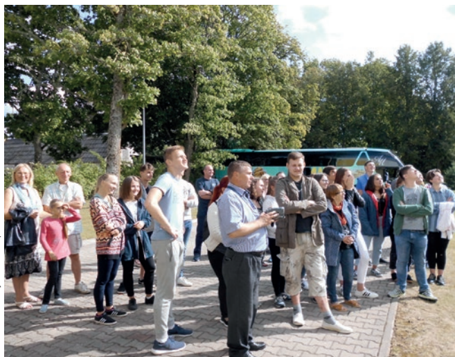
Lietuvas un Latvijas jaunieši atklāšanas brīdī

Attēls: Latvijas Jaunapustuliskā baznīca