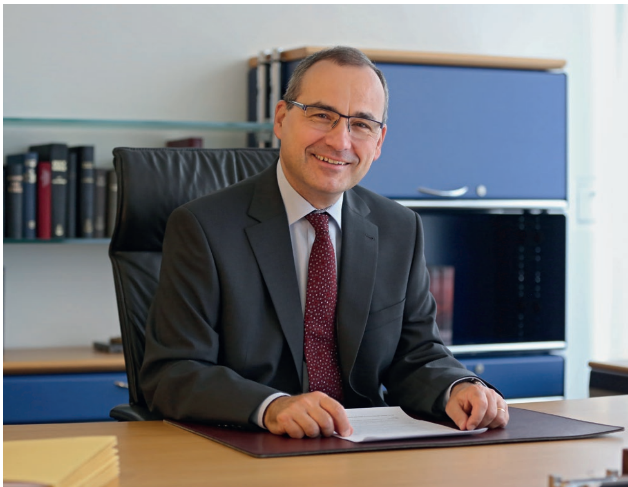
Attēls: Oliver Fürten