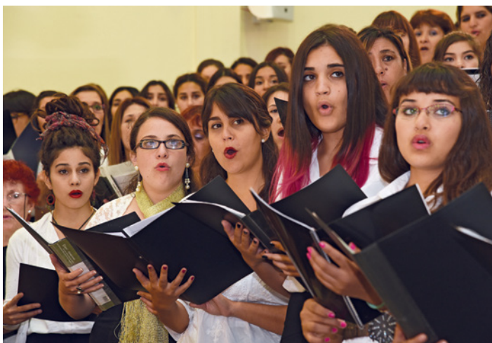
Total sebanyak 30.000 anggota di Argentina, Chile, Paraguay dan Uruguay ambil bagian dalam kebaktian yang bertempat di Buenos Aires pada awal April

Apabila kita mengalami kesusahan, marilah kita beri ruang kepada Roh Kudus agar Ia dapat memiliki suatu dampak di dalam diri kita. Allah mendengar doa-doa yang diilhami oleh Roh Kudus dan akan menyatakan kemuliaan-Nya kepada kita dan memberi kita tenaga, sehingga kita dapat menuruti-Nya.