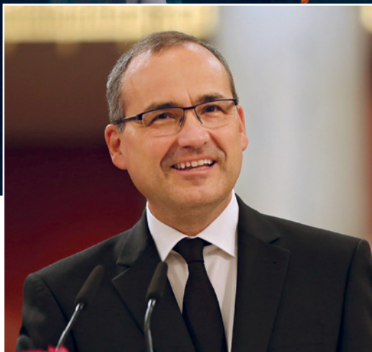
Dua ribu orang mampu menghadiri kebaktian Pentakosta di Wina (Austria) secara langsung, sementara ratusan ribu lainnya di seluruh dunia berpartisipasi dalam kebaktian melalui siaran audio-visual